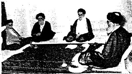
امام خطاب به شریعتمداری :

من نمی گذارم انقلاب به دست شما از بین برود