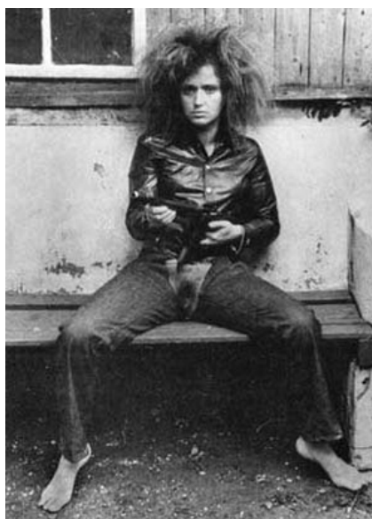
Вали Экспорт, «Генитальная паника» ( http://www.gif.ru/reviews/bi2-dnevnik-04/ ).