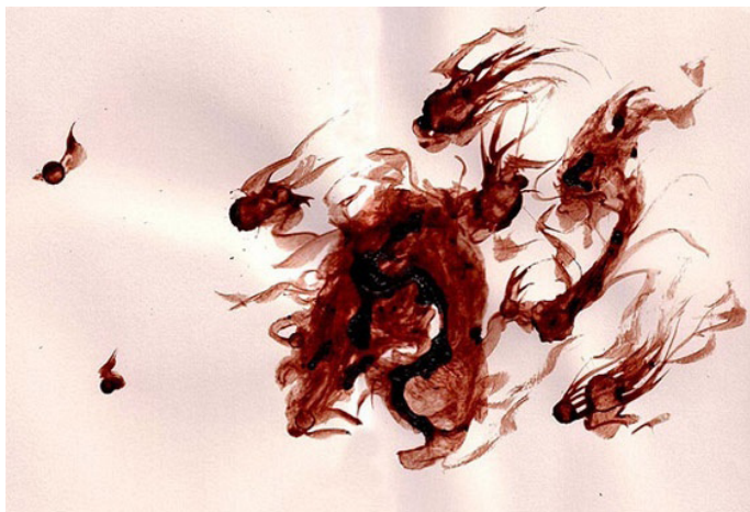
Линет Амгрен, Дракон ( http://www.kommiekomiks.com/blood-intro.htm )

В случае Фемен мы видим несколько иное – они не деконструируют патриархатную женственность: они её используют и педалируют. Однако, даже «отыгрывая» такую женственность, они не ставят её под сомнение, не дистанцируются от неё, играют по правилам патриархата. Их демонстративное «Украина не бордель» в сочетании с подчёркнуто сексуализированной одеждой (изображением проституток и постоянным обращением к этому образу на уровне знаков) подозрительно сильно напоминает классическое «нет значит да», предписываемое патриархатом женщине: демонстрировать сексуальную доступность, но изображать несогласие, поскольку порядочные женщины секса не хотят и хотеть не должны (потому что иначе они превращаются в шлюх), но готовы предоставить его достойному или просто достаточно настойчивому мужчине. Именно несоответствие между формой и содержанием их сообщения вызывает сомнение в искренности декларируемых ими лозунгов, какими бы протестными они ни были.