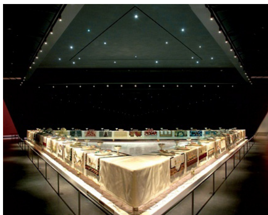
Джуди Чикаго. Ужин, инсталляция ( http://www.brooklynmuseum.org/exhibitions/dinner_party/ )