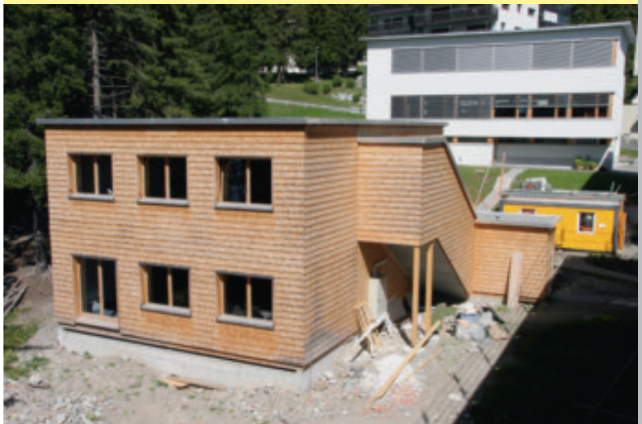
Das Chalet konnte von der Gemeinde und dem WEF übernommen werden.