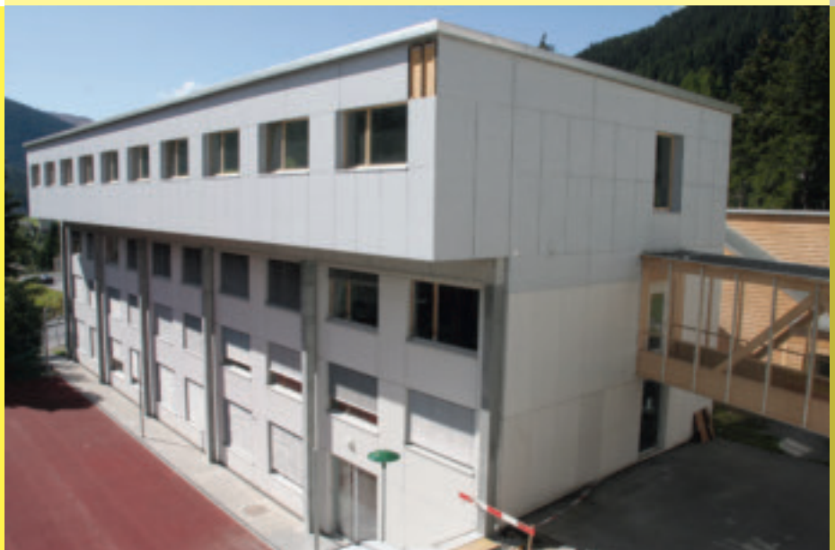
Die Aufstockung bietet 8 Doppel- und 6 Einzelzimmer, alle mit eigener Nasszelle.