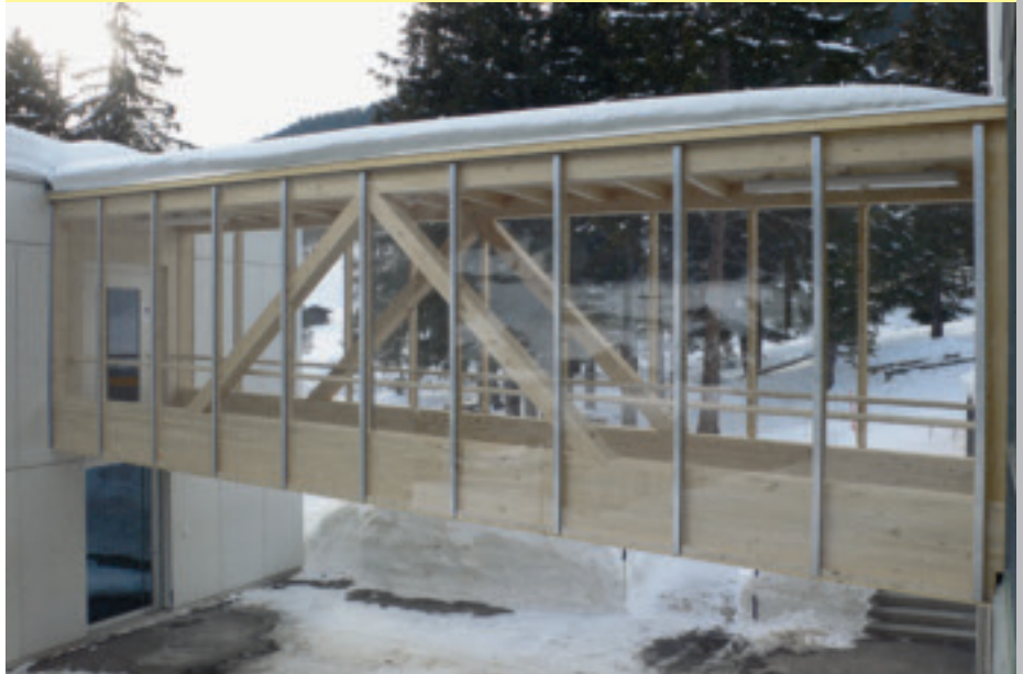
Die Passerelle ist seit Januar 2009 in Betrieb.