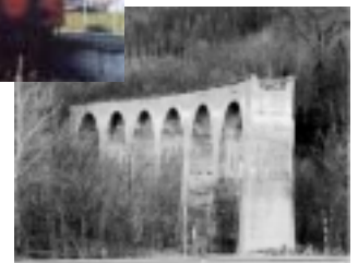
第一幾品川橋梁跡