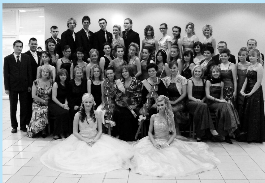
My zo 4. C a naši pedagógovia na našej stužkovej slávnosti.

Po usadení všetkých rodičov a profesorov sa oficiálne začína naša stužková. Po tomto úvodnom kroku nám dídžej pustil hudbu z Titanicu a nástup sa mohol začať. Pomalým, ale naoko istým krokom sme kráčali v dvojiciach a urobili dvojradowý zástup. Keď sme stáli všetci v plnej kráse, nasledovali príhovory. Súčasťou stužkovej býva rodičovský tanec. Aj keď ten oficiálny tancujete len s jedným rodičom, počas večera by ste na tanečnom parkete mali aspoň chvíľu stráviť s oboma. A určite by vám vo vašom fotoalbe nemala chýbať