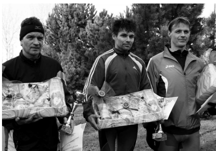
Kategória muži nad 40 rokov

Beh je športom pre všetkých, o čom svedčí aj vekové rozmedzie tohtoročných účastníkov. Vekové hranice sa každoročne posúvajú, a to nielen na hornej hranici tým, že účastníci starnú, ale vďaka čoraz väčšej obľube kategórie mini sa posúva aj spodná hranica. Tento rok sa na štart postavilo hneď niekoľko 1-1,5-ročných detičiek, ktoré rodičia od útleho veku vedú k aktívnemu spôsobu života. Bolo úžasné sledovať rozčervenané tváričky detí náhliacich sa k cieľovej čiare, z ktorých najstaršie mali 8 rokov a najmladšie sa len pred pár týždňami naučili chodiť. V cieľi si všetky s nadšením prevzali účastnícke listy a tie najrýchlejšie aj medaily a malé darčeky.