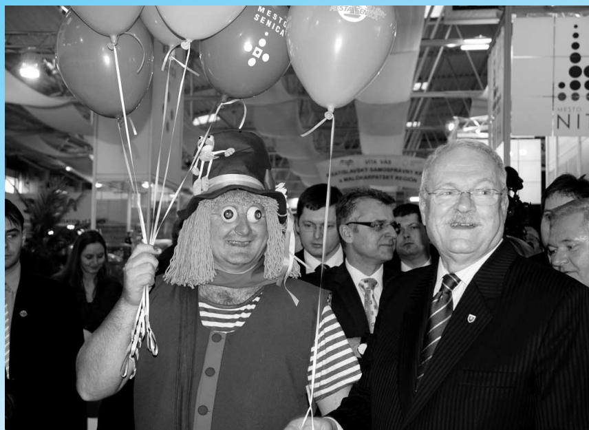
Prezidenta SR Ivana Gašparoviča na veľtrhu Slovakiatour v Bratislave pozdravil aj maskot Kunovskej priehrady.