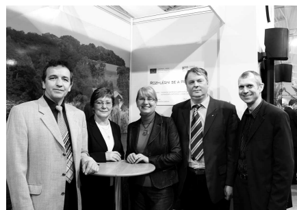
S hosťami z V. Pavlovic

lic pomocou špeciálnych techník. Kúsok zo senickej kultúry predstavili herci Záhoráckeho divadla s úryvkami zo svojich hier a tiež dobre známi Senické heligónkari.