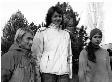
Víťazky v kategórii ženy

Potom sa už kategórie nastupovali podľa veku. Spoločne na štart nastúpili mladší žiaci, mladšie žiačky, starší žiaci i žiačky, aj dorastenci. Po nich ženy spoločne s mužmi nad 50 a nad 60 rokov, kde bežali aj najstarší účastníci tohtoročného