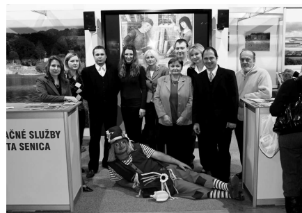
Realizátori z RSMS

Aj keď sa mesto Senica propagovalo ako moderné mesto, stánok bol oživený aj kúskom tradície. Pre návštevníkov boli počas celej výstavy pripravené ukážky z výroby šúpolienok či veľkonočných kras-