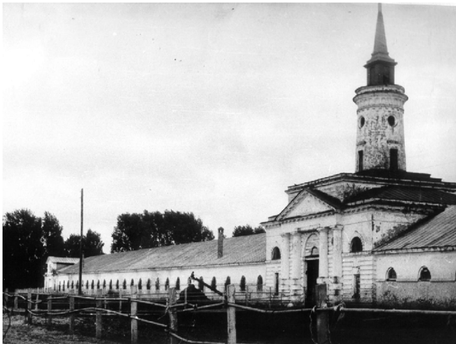
Рис. 2. Починковский конезавод. Центральный въезд

именно им были выполнены план и фасад казарм, план и фасад смотрительного двора [15].