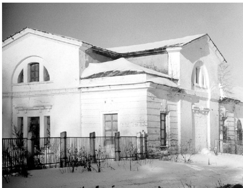
Рис. 4. Починковский конезавод. Угловой павильон