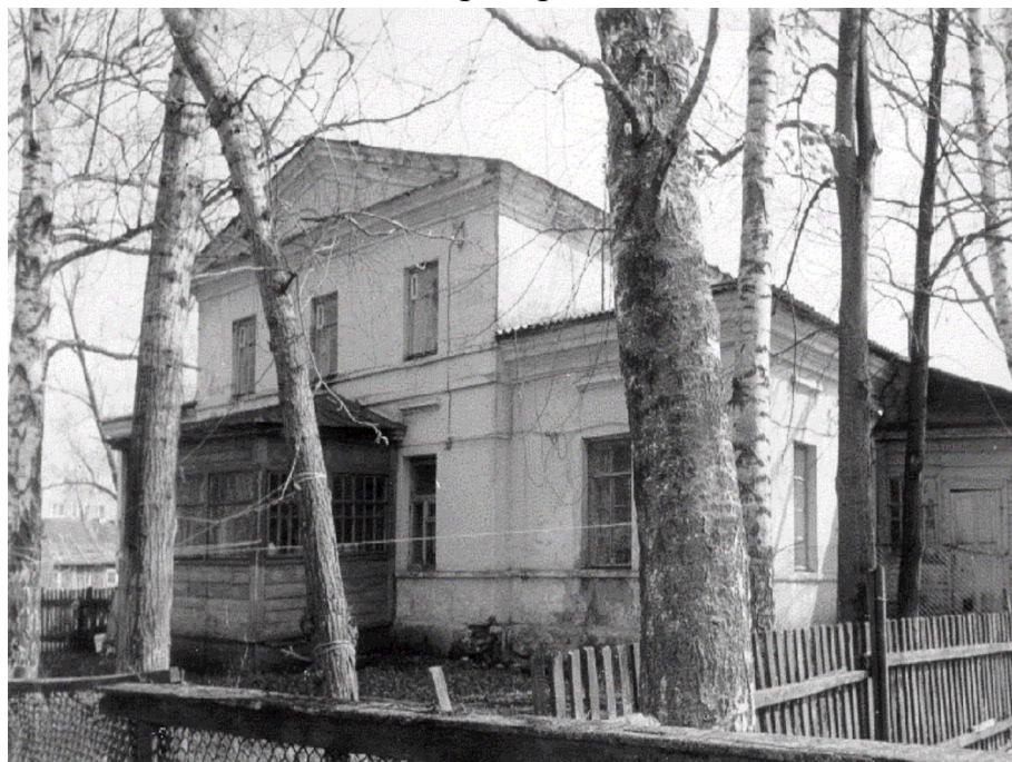
Рис. 3. Починковский конезавод. Жилой дом.

лись открытыми или акцентировались парадными арками; наружные галереи оформлялись аркадами или колоннадами. Внутренние пространства каре застраивались корпусами [24]. Таковы Табачные и Красные ряды в Костроме, гостиный двор в Кяхте, Коренная ярмарка под Курском (Д.Кваренги, 1783), упомянутые выше постройки Кутепова в Бронницах и др.