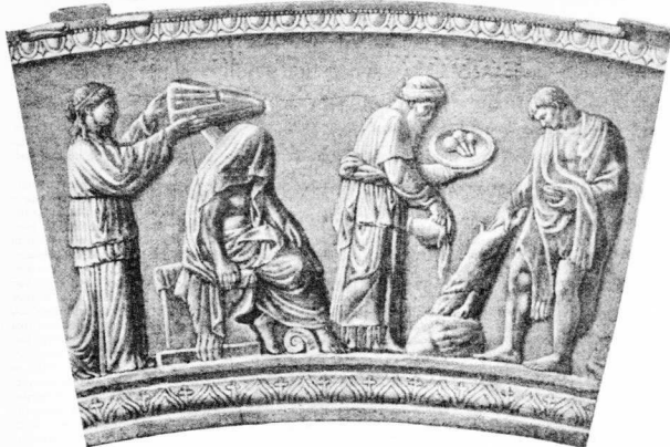
5. Ταφικό ανάγλυφο που παρουσιάζει τη Δήμητρα και την Περσεφώνη να κρατούν μονοτάρια. Βρέθηκε στα Φάρσαλα της Θεσσαλίας, Μουσείο του Λούβρου.

ψυχή χρησιμοποιώντας τις επίγειες υλικές δυνάμεις, δηλαδή πέτρες, βότανα και μαγικά άσματα (P.G 123, 1132). Ο Πρόκλος (Εις Πολ. 2, 123, 8 και Εις Κρατ. 7, 2, 10) λέει πως η ικανότητα της ψυχής να εγκαταλείπει το σώμα μας έχει παραδοθεί και από τους θεουργούς που ζούσα την εποχή του Μάρκου Αυρηλίου. Αυτό το κατορθώναν με ένα είδος τελετής. Σαν πρώτος θεουργός αναφέρεται ο Ιουλιανός που έζησε την εποχή του Μάρκου Αυρηλίου (121-180). Το λεξικό Suida μας πληροφορεί πως ήταν γιός κάποιου Χαλδαίου φιλόσοφου που λεγόταν επίσης Ιουλιανός και που είχε γράψει ένα έργο, περί δαιμόνων, σε τέσσερα βιβλία. Η θεολογία, μίγμα της Ελληνικής και Ανατολικής μεταφυσικής, εκφράζεται κυρίως από τη Νεοπλατωνική σχολή, αν και μερικώς, όπως ο Πλωτίνος χωρίς να κατακρίνουν αυτές τις πρακτικές δεν τις ενθάρρυναν. Ο Πλωτίνος (Εννεάδες, 2,9), καταφέρει εναντίον των Γνωστικών που προσπαθούν να συνδυάσουν τις παγανιστικές πρακτικές με τον Χριστιανισμό. Ο Ευνάπιος (Β. Σοφιστ. 474) μας λέει πως ο Ευσεβίος, μαθητής του Αιδεσίου που μαθήτευσε στον νεοπλατωνικό λάμβλιχο, πίστευε πως η γαεία είναι δουλειά ανισορροπών ανθρώπων που μελετούν με τρόπο αναρροδοξό ορισμένες δυνάμεις της ύλης και προεξοφεί τον μέλλοντα αυτοκράτορα Ιουλιανό να προσέχει το Θεουργό Μάξιμο: «τον θεατρικόν εκείνον θαυμασιώτατον μηδέν θαυμάσιον, ώπερ ουδέ εγώ, την δια του λόγου κάθαρσιν μέγα τι χρέμα υπολαμβάνων». Εδώ ακριβώς βρισκόμαστε και η