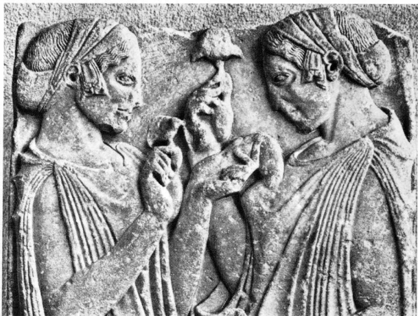
4. Ο κρητάρης Lovatelli. Παρισιάνη τη θύρα που γίνονται πριν τη μύηση του νεόφυτου, που το πρόσωπό του είναι σκεπασμένο. Στο δίσκο φαίνονται απεικονισίες μανιακών. Οι κρητάρης ήταν τα δοχεία όπου αναμιγνύονταν τα φάρμακα. Museo delle Terme, Ρώμη.

προκαλεί έκσταση ή ενθουσιασμό (το τέταρτο είδος μανίας), όπως μας τον περιγράφει ο Πλάτωνας στον Φαίδρο (249d). «Οι μύστες των Ελευσινίων δεν σχημάτισαν ποτέ ούτε μια "εκκλησία", ούτε κάποια "κινητική εταιρία", όπως έγινε αργότερα στην ελληνιστική εποχή» (Μ. Eliade, Ιστορία των θρησκευτικών απόψεων, 1, 312). Γι' αυτό στα δύο χιλιόδες χρόνια της ιστορίας τους (τα πρώτα κτίσματα της Ελευσίνας χρονολογούνται από τον δέκατο πέμπτο αιώνα (Μυλωνάς, Ελευσίς, 41), κρήτάρη πολλά πρωτόγονα στοιχεία της παλιάς θρησκείας.