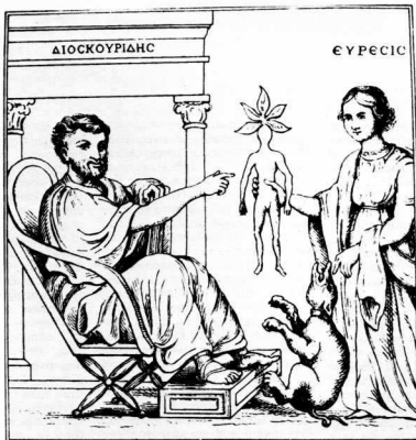
1. Αλληγορική απεικόνιση που υπαινίσσεται τις ομοιότητες του σχήματος της ρίζας του μονόγαργου με το ανθρώπινο σώμα. 6ος αιώνας. Αυτοκρατορική βιβλιοθήκη της Βιέννης.