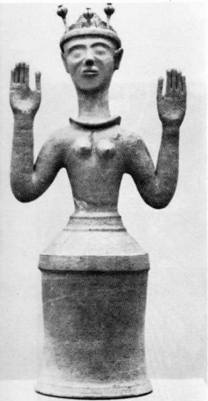
2. Οπολατρία της Ύστερης Μινωικής περιόδου. Βρέθηκε στο Γαζ. Μουσείο Ηρακλείου.