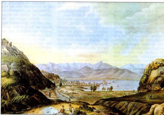
Ναύπλιο. Βορειοανατολική άποψη από την Πρόνοια. (Η ελευθέρη Ελλάς και η εσπλητημονική αποστολή του Μορέως. Το λεικωμα Πειτιέ, σ. 53, της συλλογής Στεράνου Βαλλιόδη, έκδ. της Εθνικής Τραπέζης της Ελλάδος, Αθήναι 1971).

Παραιτούμενος των χρεών με τα οποία η εμπιστοσύνη της Υ. Ε. με είχε τιμήσει και μέλλων όσον ούπω να επιστρέψω εις την πατρίδα μου, πριν αναχωρήσω από την Ελλάδα, κρίνω χρέος μου, τόσο προς την Κυβέρνησιν, ως και προς εμαυτόν και τους συμβοηθούς μου, να δώσω απλουν και αληθή λόγγων τωνπραχθέντων εις την σφαιράν της πολεμικής και οικονομικής διεθύνσεώς μου καθ'όλον το διάστημα του ενιαυτού εις το οποίον ήμουν αυτών επιφορτισμένος.