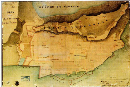
Τοπογραφικό της πόλης του Ναυπλίου, με ημερομηνία 26 Σεπτεμβρίου 1833.