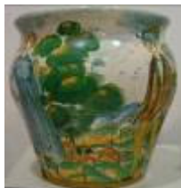
Gerro amb paisatge i dos personatges