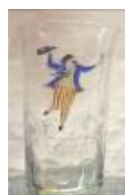
Vas decorat i amb figura masculina