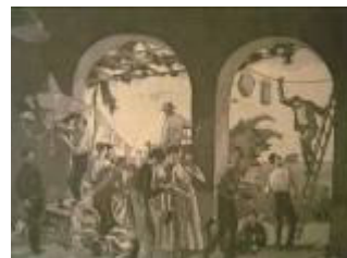
Venus i músics