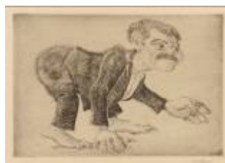
Home d'alt d'un ase