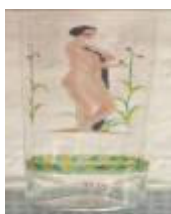
Vas decorat i amb figura femenina