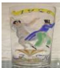
Vas amb figura masculina i femenina