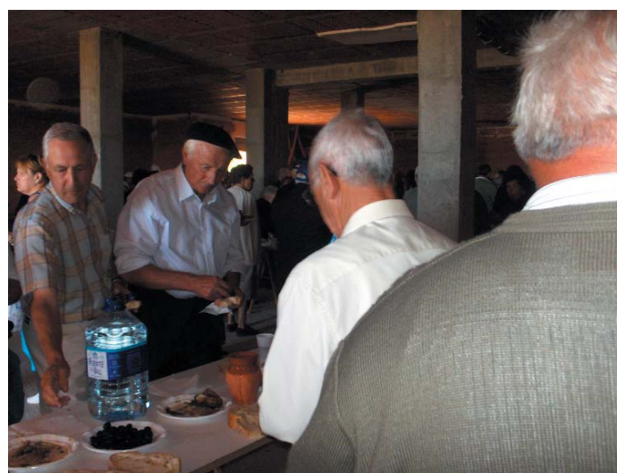
Fotos tomadas en la planta baja del Centro de Mayores, en obras.