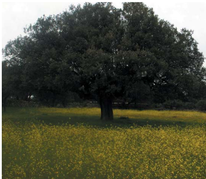
Encinas, pardas encinas: humildad y fortaleza. A. Machado. "Campos de Castilla"

La última primavera ha sido especialmente generosa. Veamos qué ha dejado entre nosotros.