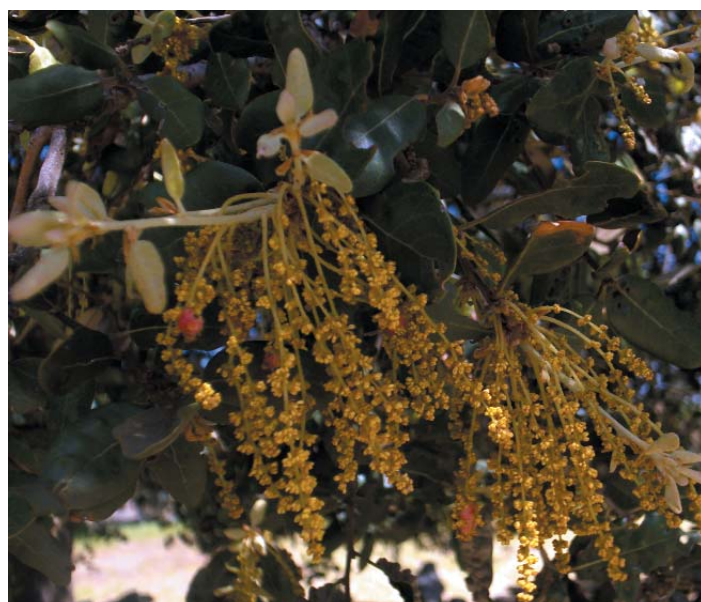
Primavera en flor. Candela

La Zarza desearía que ustedes participaran activamente en esta sección. Para ello, abriremos un buzón de imágenes, ecos de nuestra memoria, en blanco y negro. Tal vez, de este modo, seamos capaces de impedir que el ayer se borre definitivamente.