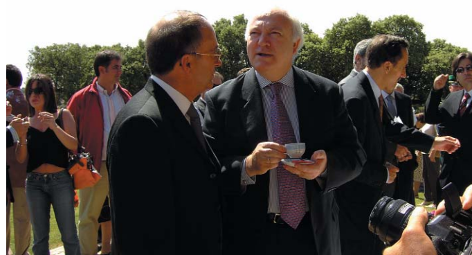
(Foto: El Alcalde-Presidente de Fariza conversa con el Ministro de Asuntos Exteriores).

2.- “El Norte de Castilla”(30/5/2006), página 5, proclama: