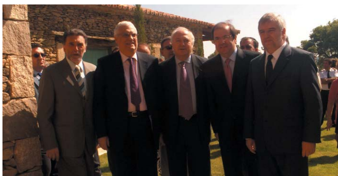
(Foto: D. Miguel Alejo, Delegado del Gobierno en Castilla y León, junto con el Embajador de Portugal en España, acompañan a las autoridades).

“Cozcurrita, centro de mando. La visita de los ministros, acompañados por numerosos cargos públicos (Presidente de la Diputación de Zamora, embajadores de España y Portugal, Delegado del Gobierno en Castilla y León y un inmenso etcétera...) hace historia en un pueblo de sólo 27 habitantes...”