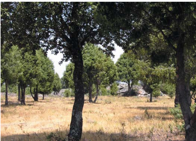
Desbroce en el camino de la ermita del Castillo, evitará posibles incendios.

Actualmente, la nueva oficina se encuentra en el segundo piso del local que fue construido para ser destinado a ayuntamiento. La limpieza de la fachada y el cambio de ventanas y puertas ha hecho que este edificio aparezca majestuoso al paso de la Virgen del Castillo, patrona del Arribe.