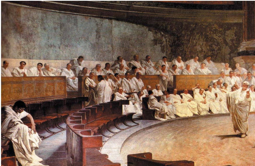
El senado romano. César Maccari, Palacio Madama, Roma

Estamos, pues, de enhorabuena: comenzamos una etapa y nace con el deseo de larga duración y mejor eficacia.