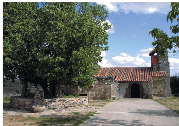
El nuevo alcorque y la fuente en la moral de Cozcurrita.

La histórica campa, el día de Procesiones, acogió a los romeros, cual elegante anfitriona, gracias a los trabajos de realizados.