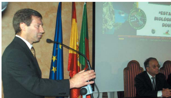
(Fotografías: David Salvador, Director Gerente de Europarques España y Julio Meirinhos, responsable de la sede portuguesa.)

Y leemos en su interior, página 8, en palabras de Begoña Galache: