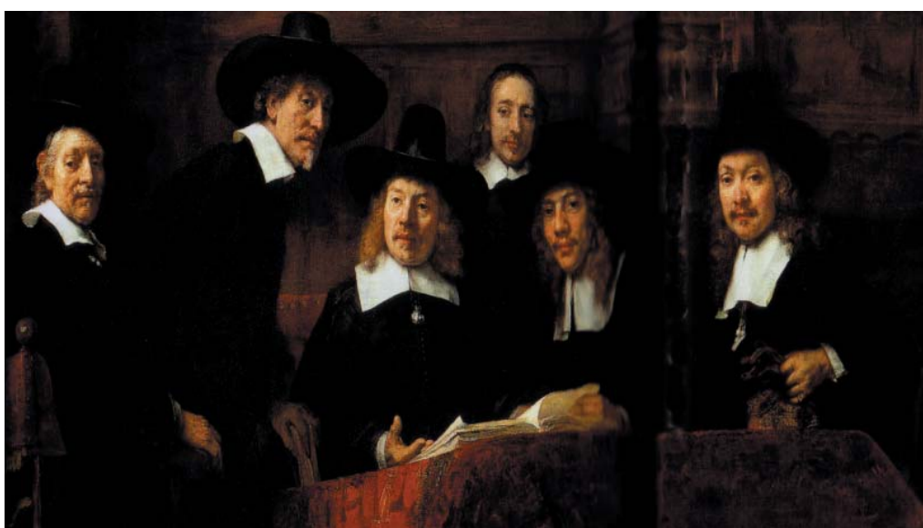
Los síndicos del gremio de los pañeros. REMBRANDT Harmensz van Rijn.1662

Esta es la línea de trabajo de la institución municipal. Brindamos al ciudadano una herramienta nueva que sustituye la charla de solana y el comentario de bar por un marco legal de uso común.