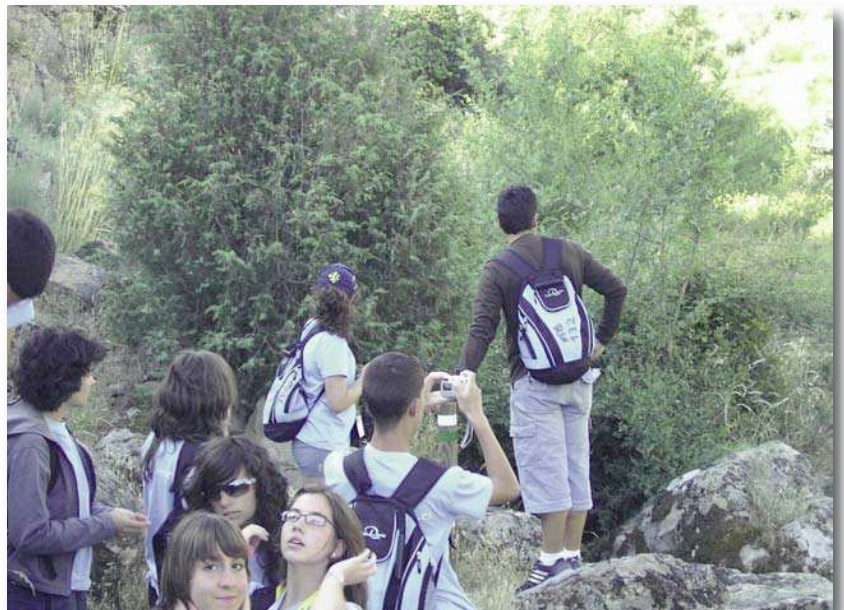
Etapa en los Arribes del Duero

Partiendo de Salamanca se dirigen a Tordesillas, Toro, Zamora, Los Arribes del Duero, Coimbra, Lisboa, Sagres, Sevilla, y termina en la ciudad extremeña de Mérida.