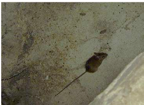
Detalles del interior del molino.