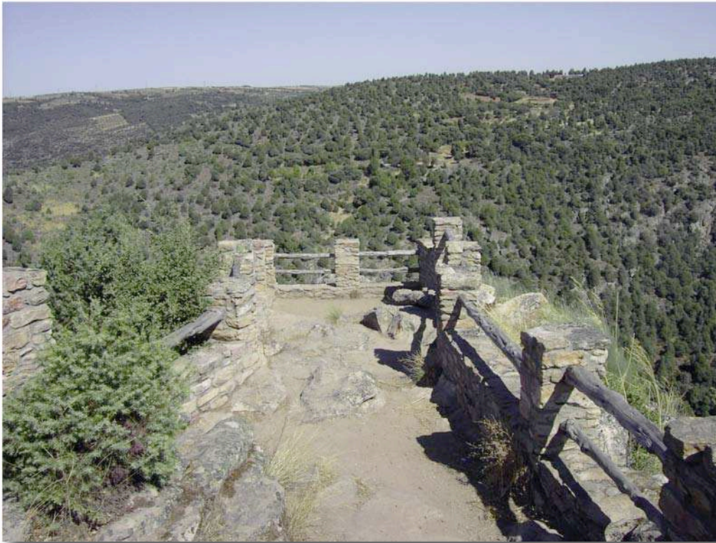
El mirador de las Barrancas, una de las primeras actuaciones.