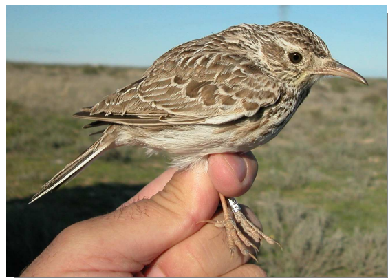
Alondra de Dupont. Primavera. Adulto (02-IV).

Presente todo el año en los lugares localizados de la Depresión del Ebro y Sistema Ibérico que mantienen vegetación arbustiva rala.