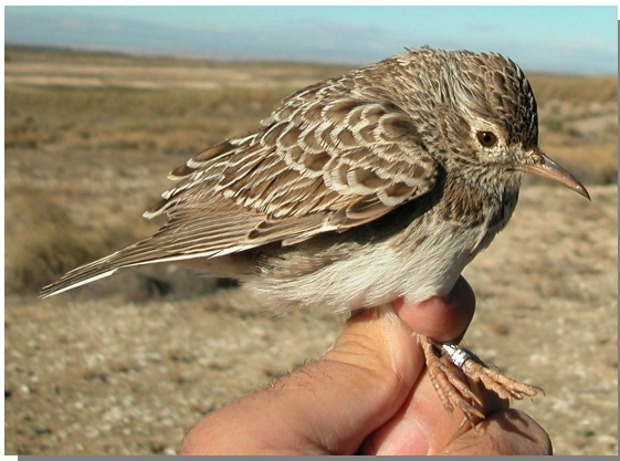
Alondra de Dupont. Otoño (24-IX).

ALONDRA DE DUPONT ( Chersophilus duponti )