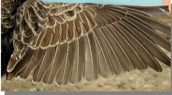
Alondra de Dupont. Otoño: diseño del ala (24-IX).