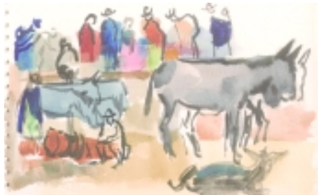
Apunte de la Manca Fiesta