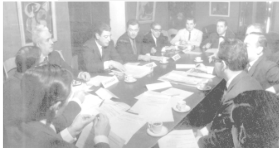
Una reunión del NOA Cultural cumplida en Tucumán en 1968

Las Naciones Unidas, en 1948, proclamaron en el artículo 27 de la Declaración Universal de los Derechos Humanos que: "toda persona tiene derecho a tomar parte libremente en la vida cultural de la comunidad, gozar de las artes y a participar en el progreso científico". Este reconocimiento implica que ante el derecho a la cultura, el Estado no puede reducir su responsabilidad social al respecto y tiene la obligación de reconocerlos y procurar su concreto ejercicio por la comunidad.