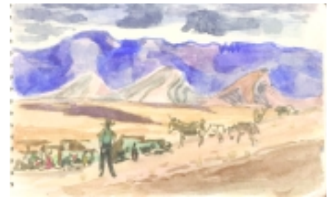
Apunte de la Manca Fiesta