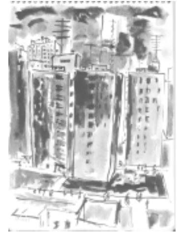
Imagen de Buenos Aires