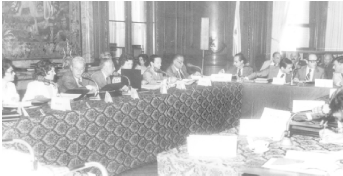
Representantes culturales de todo el país reunidos en Buenos Aires

En la primera semana del mes de marzo pasado, se cumplió la reunión anual del Consejo Provincial de Cultura organizado por la Secretaría de Turismo y Cultura con el objetivo de delinear las políticas y actividades que se cumplirán en el curso del presente año.