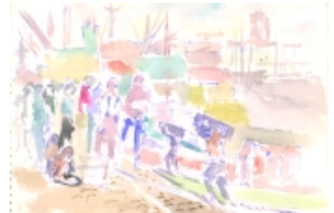
Puerto de Buenos Aires