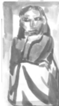
Imagen de invitación a una de sus exposiciones