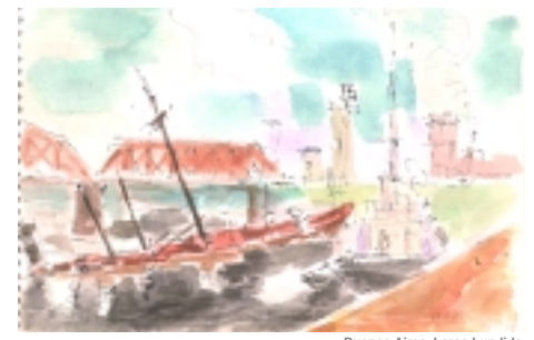
Buenos Aires, barco hundido