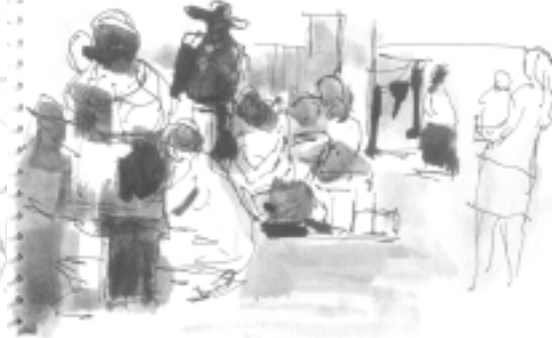
La Manca Fiesta, La Quiaca