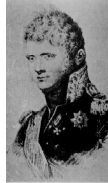
Ο Τσάρος Αλέξανδρος Α΄.

Την εντολή της ομαλοποιήσεως της έκρυθμης κατάστασης που είχε δημιουργηθεί στα Επτάνησα, ο τσάρος Αλέξανδρος Α΄ την ανέθεσε στον κόμη Γεώργιο Μοσενίγο, που καταγόταν από τη Ζάκυνθο, απεσταλμένος της Επτανήσου Πολιτείας στην αυτοκρατορική αυλή της Πετρούπολεως και άλλοτε πρεσβευτής του τσάρου στην Τοσκάνη. Εφοδιασμένος με την κατοχυρωτική πράξη, του καθεστώτος προστασίας της Επτανήσου Πολιτείας από τις σύμμαχες δυνάμεις, 47 και το διαπιστευτήριό του 48 ο Ζακυνθινός κόμης Γεώργιος Μοτσενίγος έφθασε στις 16 Αυγούστου 1802 στην Κέρκυρα, μετά στρατού και στόλου, απεσταλμένος του αυτοκράτορα της Ρωσίας στα Επτάνησα ως πληρεξούσιος υπουργός, για να συμβάλει στην αποκατάσταση της τάξης, στην πολιτική σταθερότητα και στην αναδιοργάνωση των νησιών.