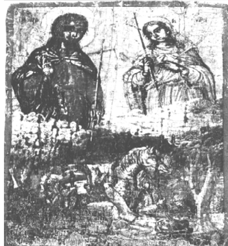
1. Εικόνησμα με τους Αγίους Τιμόθεο και Μαύρα στους οποίους αποδόθηκε η σωτηρία του Καποδίστρια.

Ο Καποδίστριας ως απεσταλμένος της Επτανησιακής Πολιτείας, οργανώνει τη διοίκηση της Κεφαλονιάς σύμφωνα με το σύνταγμα του 1800.