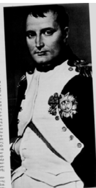
Ο Μέγας Ναπολέων ο Βοναπάρτης

Έτσι το ζήτημα της άμυνας της Λευκάδος ξεπέρασε τα όρια της Επτανήσου Πολιτείας και πήρε διαστάσεις πανελλήνιες. Οι δυνάμεις του Έθνους ενωμένες συνεργάζονταν για την αντιμετώπιση του κοινού εχθρού. Αρκετά χρόνια αργότερα στο υπόμνημά του ο Καποδίστριας προς τον τσάρο της Ρωσίας Νικόλαο θα γράψει σχετικά με την περίοδο αυτή: « Αι σχέσεις μου λοιπόν προς τους Έλληνας της Ηπείρου, της Πελοποννήσου και του Αιγαίου χρονολογούνται αφ' ης εποχής, υπηρετών την πατρίδα μου, υπηρετούν συγχρόνως και την Ρωσίαν, επί τω μεγάλω σκοπώ να προφυλάξω την Ελλάδα από τους πειρασμούς της γαλλικής πολιτικής. Χάρις εις τα ισχυρά μέσα, άτινα η γενναιόδωρος πολιτική του αυτοκράτορος Αλεξάνδρου έθετεν εις την διάθεσιν της Ιονίου κυβερνήσεως, μοι ήτο εύκολον να εκπληρώσω το καθήκον τούτο, διεγείρων εν τη γενναία και εξόχως χριστιανική ψυχή των αρχηγών της Ελλάδος τα έμφυτα εις αυτούς αισθήματα και πείθων αυτούς περί του ότι μόνη η Ρωσία είχε την δύναμιν και την θέλησιν να βελτιώση βαθμηδόν την τύχη των ». 64