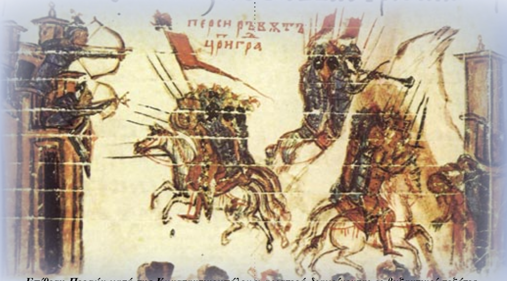
Επίθεση Περσών κατά της Κωνσταντινουπόλεως· αριστερά διακρίνονται οι βυζαντινοί τοξότες (Βατικανό, Αποστολική βιβλιοθήκη)

Το ρωμαϊκό αετό στη βυζαντινή σημαία επανέφερε ο αυτοκράτορας Ιουλιανός (361-363), γνωστός και ως Αποστάτης ή Παραβάτης (λόγω των ειδωλολατρικών του αντιλήψεων), ξεσηκώνοντας θύελλα αντιδράσεων στην Κωνσταντινούπολη. Μετά το θάνατό του, το μισητό πλέον μισοφέγγαρο (υπήρξε το έμβλημα της θεάς Αρτέμιδος) διαγράφηκε από τη σημαία, διατηρήθηκε όμως ο περήφανος αετός που έβλεπε δεξιά, ο οποίος και