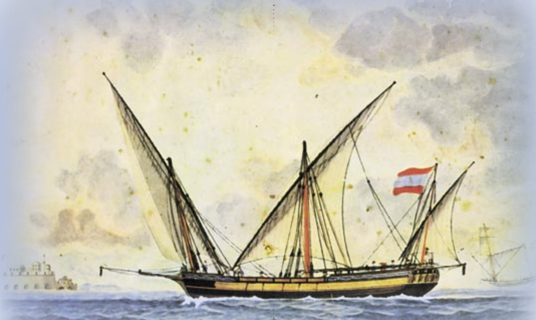
Από το 1774, μετά τη συνθήκη του Kucuk Kainargi, η ρωσική σημαία κυμάτιζε στα ελληνικά εμπορικά πλοία (η γραικοτουρκική σημαία)

και της Ρωμυλίας (έφερε τους Αγίους Κωνσταντίνο και Ελένη).