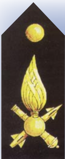
Οπλόσημο του Πυροβολικού

πιο εκλεπτυσμένο όπλο, ο «πρίγκιπας» του Στρατού), επικράτησε μια περιδεής φήμη ότι τάχα το Πυροβολικό στερείται τη δάφνη επειδή είναι «άτιμο Σώμα», γιατί δήθεν κατά τον ατυχή Ελληνοτουρκικό Πόλεμο του 1897 έχασε τη σημαία σε μια μάχη (υπάρχει και παραλλαγή που το φέρει να αποκοιμήθηκε στο πεδίο της μάχης). Κάτι τέτοιο σαφώς δεν ισχύει (το Πυροβολικό ουδέποτε είχε σημαία, με αποτέλεσμα να μην μπορεί να τη χάσει!), ούτε ανταποκρίνεται στην πραγματικότητα, αλλά είναι ενδεικτικό της σοβαρότητας που κατέχει στη συνείδησή μας η απώλεια της σημαίας.