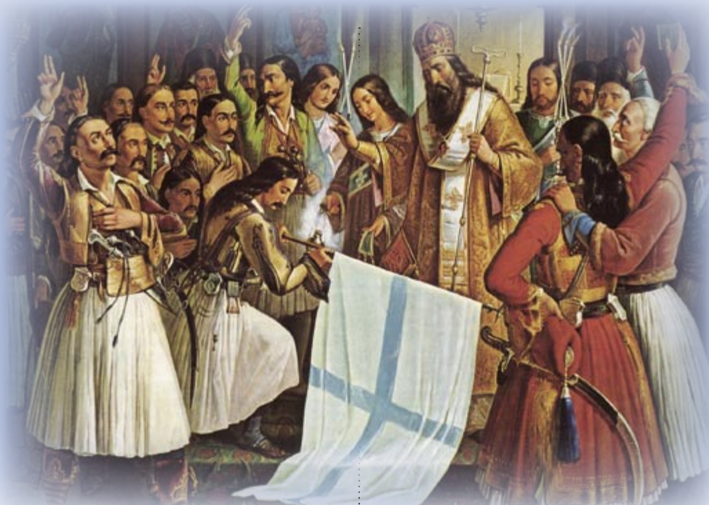
Οι επαναστάτες ορκίζονται και ο Παλαιών Πατρών Γερμανός ευλογεί τη σημαία του Αγώνος (Αθήνα, Εθνική Πινακοθήκη)

του Μάρτη), οπλαρχηγοί, πρόκριτοι, προεστοί, αρχιερείς και πολυάριθμα παλικάρια συγκεντρώνονται στη Μονή της Αγίας Λαύρας, έχοντας ως λάβαρο τη χρυσοκέντητη εικονισματοποδιά της Κοίμησης της Θεοτόκου που κοσμούσε την Ωραία Πύλη του ναού της Μονής, την οποία - σύμφωνα με την παράδοση - ύψωσε ο Παλαιών Πατρών Γερμανός, ορκίζοντάς τους. Το λάβαρο της Αγίας Λαύρας, το οποίο φυλάσσεται στο θησαυροφυλάκιο της Μονής, είναι βυσσινί, κεντημένο με ασημένια και χρυσή κλωστή και στολισμένο με μαργαρίτες, με χρυσά κρόσια ολόγυρα. Σε λίγες ώρες, οι ξεσηκωμένοι ραγιαδες κυριεύουν τα γειτονικά Καλάβρυτα, ενώ στις 24 Μαρτίου εισέρχονται στην Πάτρα ο Μπενιζέλος Ρούφος, ο Ασημάκης Ζαίμης και άλλοι οπλαρχηγοί, μαζί με τον Επίσκοπο Γερμανό, ο οποίος υψώνει στην πλατεία του Αγίου Γεωργίου ένα μεγάλο ξύλινο σταυρό, σύμβολο της Επανάστασης, υπό τις ιαχές και ενθουσιώδεις κραυγές των Ελλήνων,