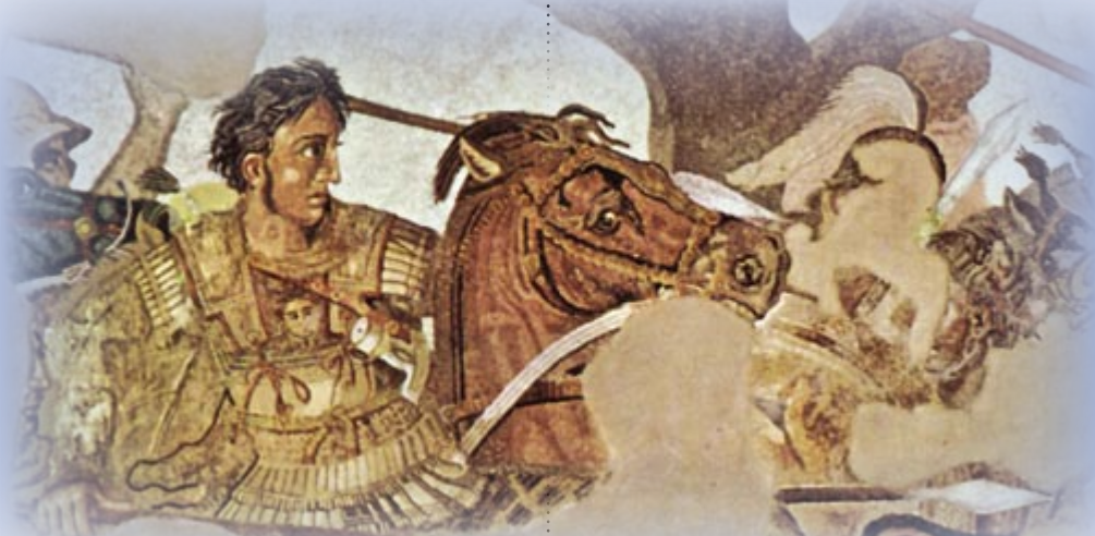
Ο Αλέξανδρος κατά τη μάχη της Ιασού (Νεάπολις, Εθνικό Μουσείο)

Στην αρχαία εποχή, οι πρώτοι που επιβεβαιωμένα έκαναν χρήση σημαιών στον πόλεμο ήσαν οι Σκύθες (Σουίδα εν λέξει). Υπάρχουν πληροφορίες ότι οι φάλαγγες του Μεγάλου Αλέξανδρου χρησιμοποιούσαν κόκκινες υφασμάτινες σημαίες, τις οποίες ύψωναν σε σάρισες και έδιναν το σήμα έναρξης της μάχης. Αργότερα, βλέπουμε ότι και οι υπόλοι-