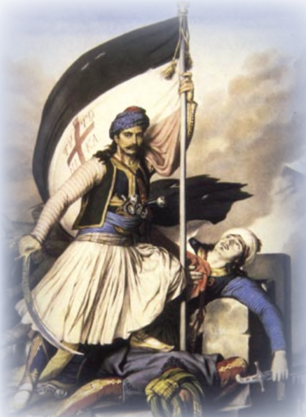
Η σημαία αυτή είναι όμοια με εκείνη που ύψωσε ο Αλέξανδρος Υψηλάντης το Φεβρουάριο του 1821 στο Ιάσιο Μολδαβίας

Η παλαιότερη από τις επαναστατικές σημαίες, αν εξαιρέσουμε τις ήδη υπάρχουσες πριν από την Επανάσταση, ήταν αυτή της Φιλικής Εταιρείας. Κατασκευάστηκε με τις οδηγίες του Παλαιών Πατρών Γερμανού από λευκό ύφασμα και έφερε τα σύμβολα του εφοδιαστικού των ιερέων της Φιλικής Εταιρείας (τον ιερό δεσμό με τις 16 στήλες) και πάνω από αυτό κόκκινο σταυρό, περιβαλλόμενο από στεφάνι κλαδιών ελιάς· κάτω από το σταυρό υπήρχαν δύο λογχοφόρες σημαίες με τα αρχικά ΗΕΑ και ΗΘΣ (ή Ελευθερία ή Θάνατος). Παραλλαγές και προσθήκες (ανεστραμμένη ημισέληνος, φίδι, σταυρός, κουκουβάγια κ.τ.λ) στο εφοδιαστικό των ιερέων βρίσκουμε σε διάφορες σημαίες. Το Αχαικόν Διευθυντήριο φρόντισε να κατασκευάσει και να διανείμει αρκετές Φιλικές σημαίες στα στρατόπεδα της Πελοποννήσου. Μία από αυτές ύψωσε ο Γεώργιος Σισίνης το 1821 στην Ήλιδα, τη μοναδική που σώζεται σήμερα (συλλογή Εθνικού Ιστορικού Μουσείου). Σ' αυτήν τη σημαία ορκίζονταν, ενώπιον του ιερέα και του ευαγγελίου, οι μνημένοι στη Φιλική Εταιρεία και αυτή αρχικά προοριζόταν για να καθιερωθεί ως επίσημη σημαία της Επανάστασης και, μετέπειτα, του Ελληνικού Κράτους.