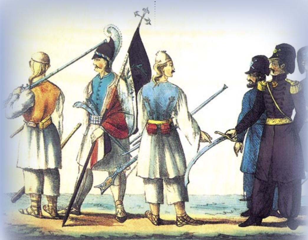
Prince Démétrius Upsilonanti, accompagné de deux aides de Camp, donne des ordres au porte étendard Έγχρωμη λιθογραφία που απεικονίζει το Δημήτριο Υψηλάντη

Γ. Σακελλαρίου Φιλική Εταιρεία , το οποίο εκδόθηκε στην Οδησό το 1909.