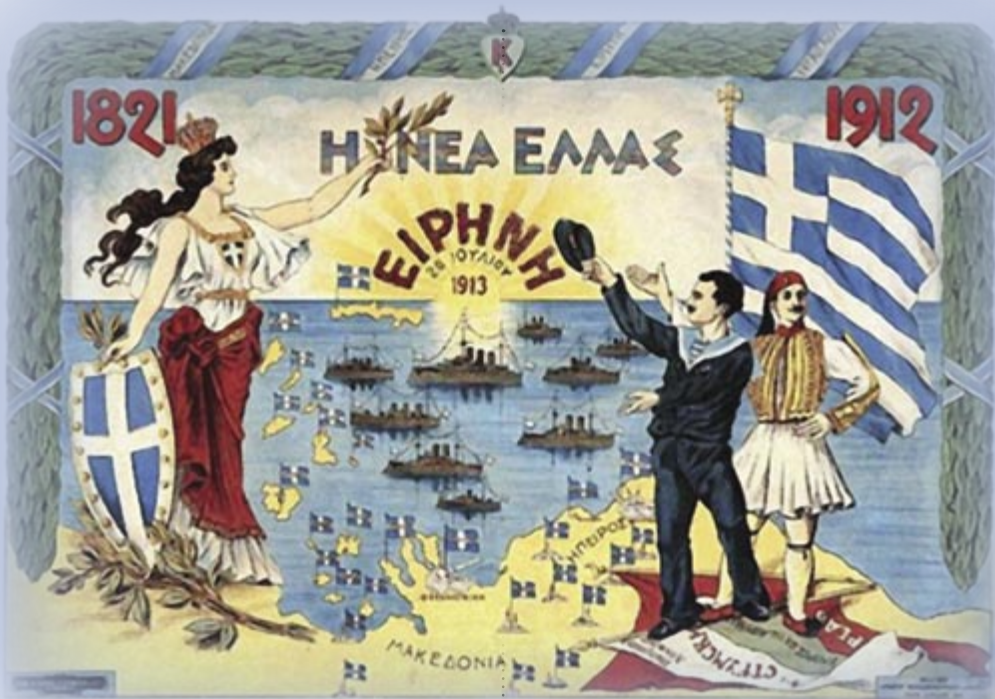
Αφίσα του 1912 με τα νέα απελευθερωμένα μέρη

καθόριζε το σχήμα και τις αναλογίες διαστάσεων της επίσημης βασιλικής σημαίας, προσθέτοντας το βασιλικό στέμμα στο κέντρο του σταυρού των σημαιών του Πολεμικού Ναυτικού και των Φρουριών, ενώ η βασιλική σημαία θα έφερε στο μέσο του σταυρού τα εμβλήματα του κράτους και τα οικοσχημα της βασιλικής οικογένειας. Επίσης, με Βασιλικό Διάταγμα καθορίζονται οι πολεμικές σημαίες των Ταγμάτων στις 9 Απριλίου του 1864, διατηρώντας μέχρι σήμερα την ίδια μορφή, δηλαδή κυανόλευκη με σταυρό, μεταξωτή με χρυσά κρόσια ολόγυρα - συμβολίζουν τις ψυχές που η πατρίδα εμπιστεύεται στη σημαία - και με τον έφιππο Άγιο Γεώργιο στη μέση. Οι διαστάσεις των σημαιών περιλήφθηκαν και σε νέο Βασιλικό Διάταγμα, που εκδόθηκε στις 26 Σεπτεμβρίου του 1867.