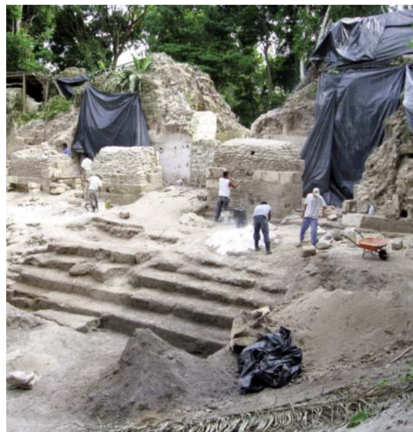
Fig. 2 El Cuarto 7, en el patio interior de la Acrópolis, durante el proceso de excavación.

shared a similar history to that of the settlers at La Blanca. When these settlers, who could very well have been displaced people in search of refuge, reached La Blanca, a great number of its beautiful buildings had already collapsed. They therefore established themselves next to the ruins of the big