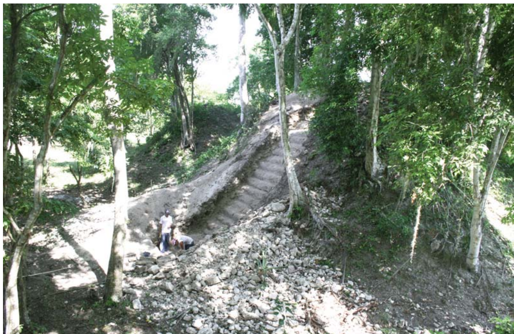
Fig. 7 Excavación de la escalinata central del basamento piramidal correspondiente al edificio 10L2 del Grupo Sur.

No obstante, aún quedan varios interrogantes por resolver acerca de las fases de ocupación más antiguas de la ciudad, pero confiamos que en próximas campañas de investigación puedan ser resueltos con el fin de obtener un conocimiento muy profundo y científico acerca de esta ciudad maya de la cuenca baja del río Mopán.