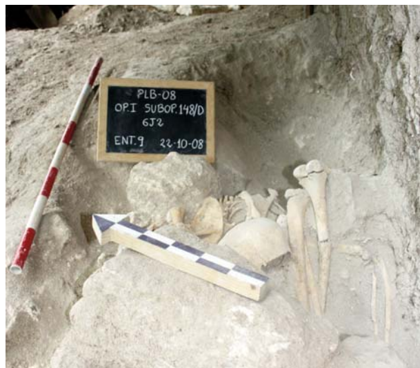
Fig. 4 Enterramiento 9, en el interior del Cuarto 4.

El contexto en que fue hallado no es funerario, pues se trata de un enterramiento sencillo en los niveles de derrumbe y escombros que colmataban el Cuarto 7, de ahí que no se hayan encontrado materiales arqueológicos asociados, a excepción de algunos fragmentos óseos pertenecientes a pequeños roedores.