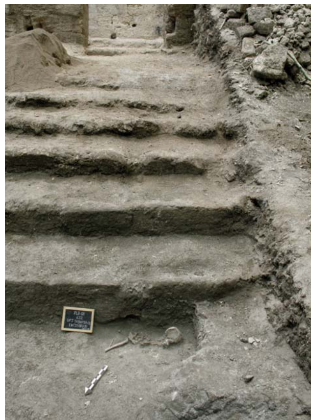
Fig. 5 Enterramiento 10, a los pies de la escalinata que parte del patio interior de la Acrópolis.

Finally, we would like to make a brief mention of the cooperation activities with the community of La Blanca that we carried out in parallel with our scientific investigations. We refer to the workshops dealing with the conservation and preservation of the cultural and in particular archaeological heritage, that we have organized for to the pupils at the two schools in La Blanca; an initiative which began in the two previous field seasons. Furthermore, the construction of the Interpretation Centre at the entrance to the La Blanca ruins, with aid from the Vice Rectorat for Cooperation of the University of Valencia, permitted even more involvement from the surrounding residents in the maintenance and care of the archaeological ruins.