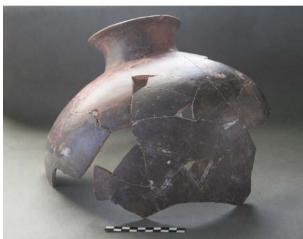
Fig. 6A (arriba), 6B (centro) y 6C (abajo) Recipientes cerámicos del Postclásico Temprano (A) y el Clásico Terminal (B y C) hallados durante la temporada de campo 2008.