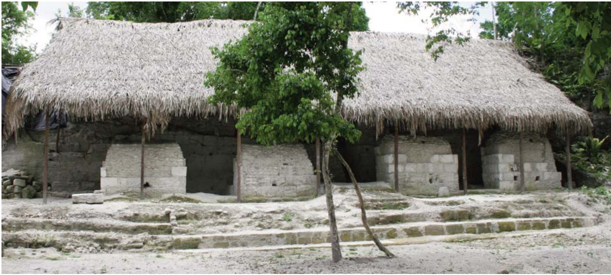
Fig. 3 El Cuarto 7 una vez concluida su excavación y las intervenciones de consolidación, restauración y protección de la arquitectura.

bóveda colapsó y las dovelas se desplomaron en el interior del cuarto. No había huella de los dinteles, pero es muy posible que hayan sido de madera (Muñoz 2009).