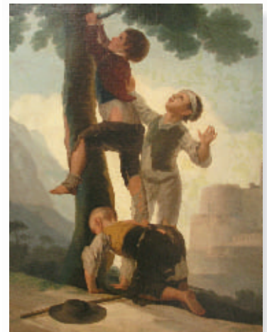
Abb 3: Kind mit einer Tinea capitis microsporiga. Gemälde „Knaben beim Erklimmen eines Baumes“ von Francisco de Goya, Prado, Madrid.