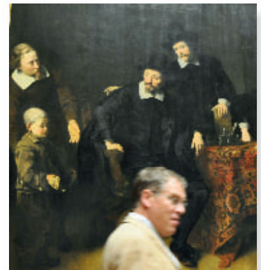
Abb. 2: Kind mit Tinea capitis favosa. Ausschnitt aus einem Gemälde von Ferdinand Bol, Kunsthistorisches Museum, Wien.

Hier sei noch ein wichtiges Zitat von Götz 1962 [6] angeführt; im Hinblick auf sehr lange Behandlungszeiten der Mikrosporie und hier vor allem bei Infektionen durch Microsporum canis merkt er an: „Die Persistenz wird auf den Umstand zurückgeführt, dass zwar die meisten Haare bald pilzfrei werden, hingegen lebensfähige Sporen noch längere Zeit im Follikel liegen bleiben können.“ Dieser Umstand gilt auch für vorpubertäre Kinder, die heute mit Terbinafin, Itraconazol oder Fluconazol behandelt werden. Der Haarfollikel ist eine Hauteinstülpung, in deren Lumen kein Wirkstoff gelangen kann, es sei denn über den Talg, der allerdings erst nach der Pubertät gebildet wird. Dieser Umstand ist bei neueren Studien nie beachtet worden! Die hohen Griseofulvin-Konzentrationen im Schweiß, – auch bei vorpubertä-