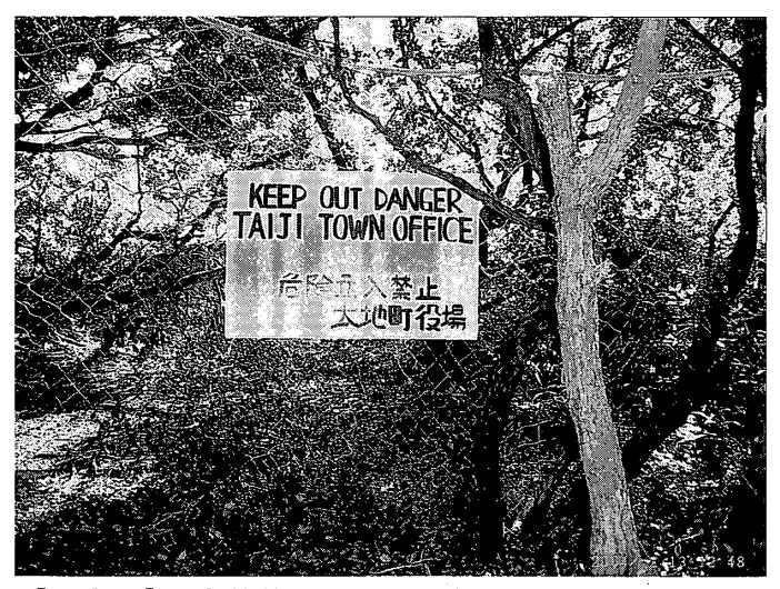
[写真3] 事件後設置された網と立ち入り禁止の札 (2004年)