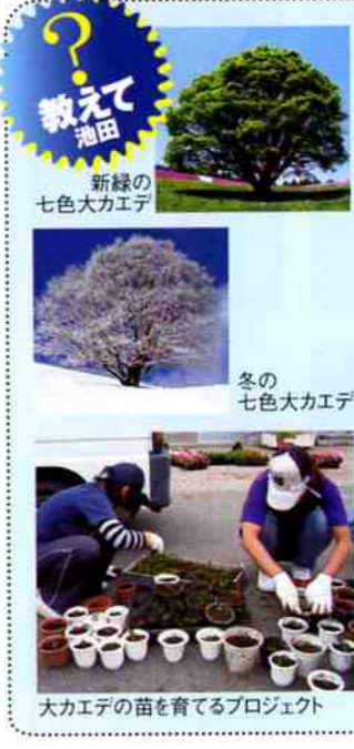
大カエデの苗を育てるプロジェクト

大峰高原 七色大カエデ物語 大峰高原に、悠々とそびえ立つ樹齢250年ともいわれる七色大カエデ。高さ、約12m、四方に伸びた枝先の直径は約15mある。終戦直後の昭和22年、開拓使がこの地に訪れ、終戦直後の食糧難から作物を作るために畑としてこの地を開墾していった。その時に、一帯にあった木々は伐採され、この七色大カエデも一度切り倒されているそう。時がたち、現在の所有者が、荒れ放題であったこの地を買ったとき、目の前に飛び込んできたのは、見事に成長したこの七色大カエデ。あまりの雄大な姿に圧倒されたという。さわやかな新緑の緑から、やがて黄色や朱色の美しいグラデーションに包まれ、しっとりとした雪化粧する姿は生命力にあふれている。訪れる人の心を魅了し、現在では県内外から多くのカメラマンやスケッチを楽しむ人が訪れている。2008年2月、近くにもう一本の大カエデが発見された。