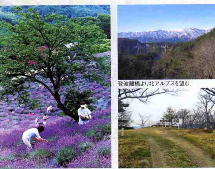
夢農場 お茶屋峯の松跡