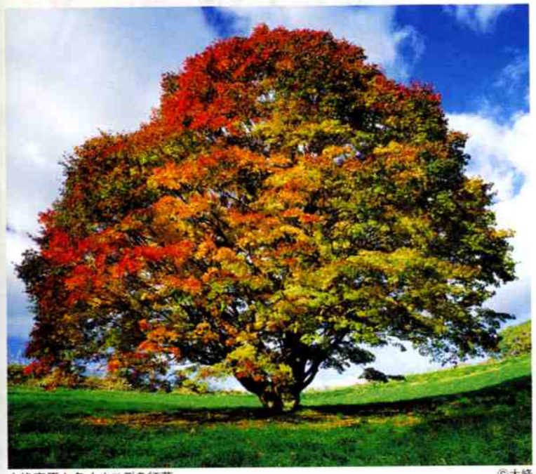
大峰高原七色大カエデの紅葉