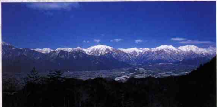
大峰高原より北アルプスを望む