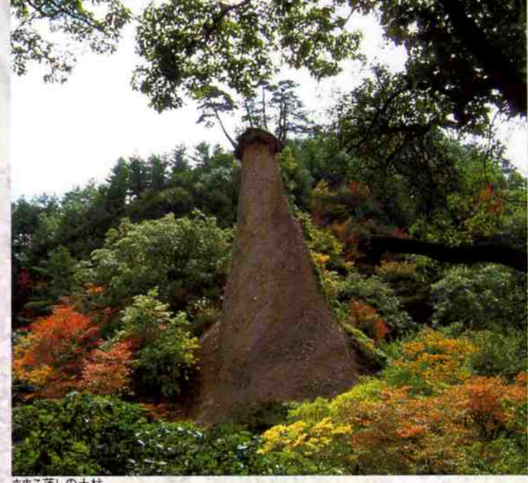
ままご落としの土柱