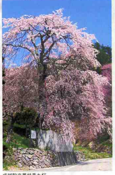
成就院来鳳枝垂れ桜