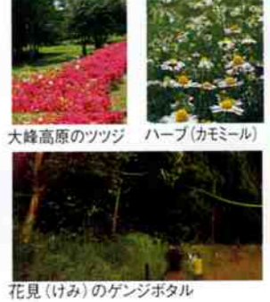
大峰高原のツツジ ハーブ(カモミール)