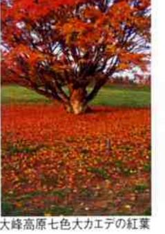
花見(けみ)のゲンジボタル 大峰高原七色大カエデの紅葉