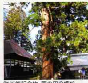
町天然記念物・菅の田の姫杉