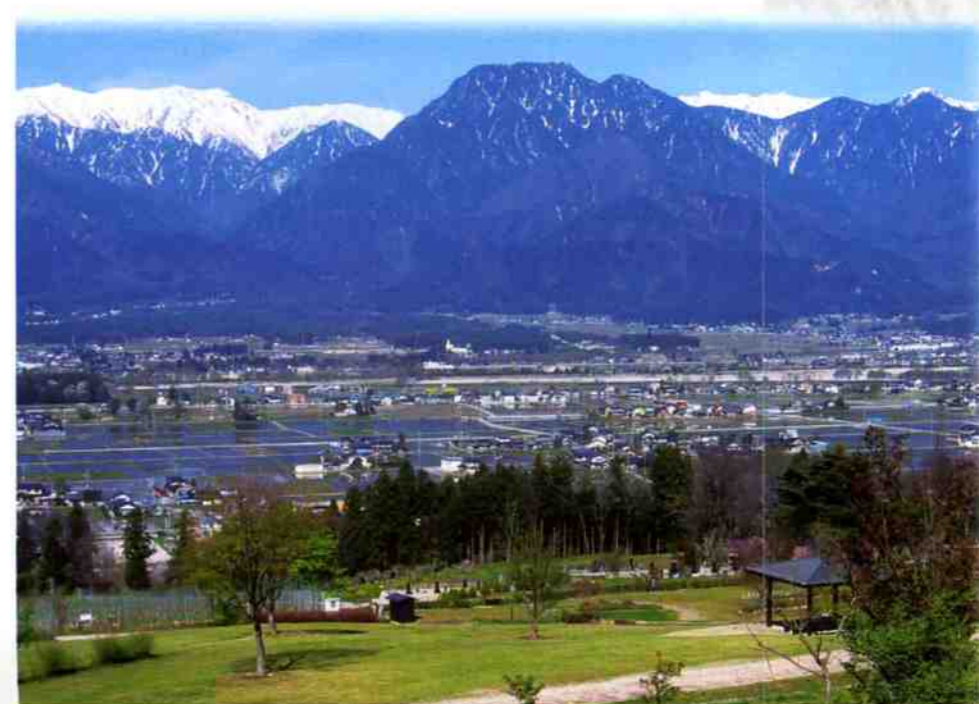
あづみ野池田クラフトパークより北アルプスの眺望

花とハーブが香るやすらぎの里、池田町。信州安曇野の北部に位置する田園風景の美しい、のどかな町です。信濃富士とも呼ばれる「有明山」や北アルプス連峰を見わたすワイドビューが見事。春は、鶴山・大峰の桜並木・成就院の枝垂桜、山一面に広がる陸郷の山桜が咲き誇り、秋になるとカエデの紅葉、冬は雪化粧をした北アルプスが楽しめます。また、「安曇野北アルプス展望のみち」は日本ウォーキング協会が選定した「美しい日本の歩きたくなるみち500選」に認定されています。2009年10月「日本で最も美しい村」連合に加盟しました。①④⑥はエコウォーク公認コースです。