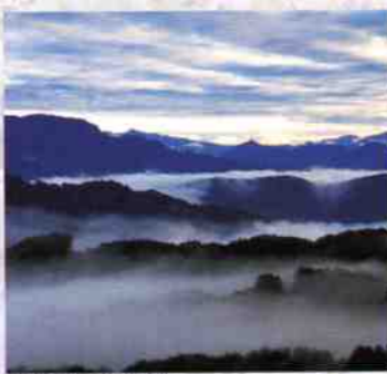
大峰高原からの雲海 カモミール花畑

「石造百体仏像」と呼ばれる石仏群や「毘沙門天」など県宝や町文化財に指定された多くの仏像が安置されており、深い歴史を守り続けている地域として知られている。標高919mの高照山展望台からは遠く浅間山を望むことができ、有志の方によって育てられている桜やシラネアオイも見どころとなっています。 ※エコウォーク公認コース