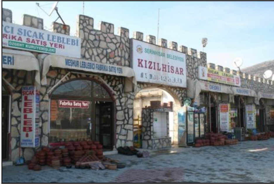
Fotoğraf 5. Antalya-Denizli karayolu kenarında leblebi satış mağazaları (Serinhisar).

kesiminde yolun iki kıyısında 20 kadar leblebi satış mağazası bulunur. Bunun yanı sıra Gazi, İnönü, Bahabey ve Osmancık caddeleri üzerinde de perakende satış mağazaları yoğunlaşmıştır (Şekil 4). Benzer olarak Serinhisar’da da leblebi satış mağazaları Denizli-Antalya karayolu kenarında yoğunlaştığı görülür. Günümüzde burada 20’den fazla perakende satış mağazası bulunur (Fotoğraf 5).