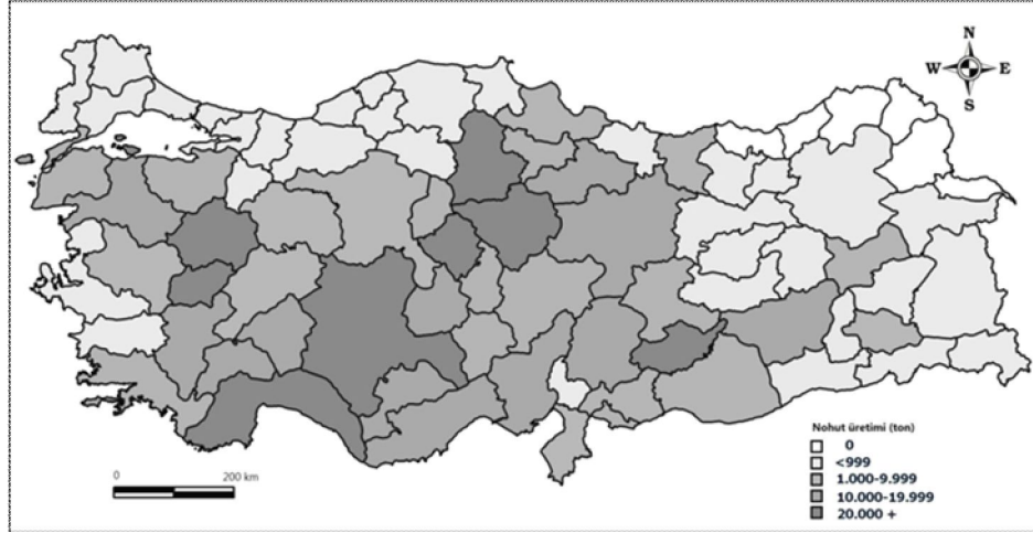
Şekil 1. Türkiye’de nohut üretiminin illere göre dağılışı ( TUİK, 2008 verilerine göre hazırlanmıştır).

2008 yılında nohut üretiminin 20 bin tonun üzerinde gerçekleştiği 8 il vardır (Şekil 1). Bunlar sırasıyla Uşak, Antalya, Kütahya, Konya, Çorum, Yozgat, Kırşehir ve Adıyaman’dır. Örneklem alanların il bazında üretimlerine bakıldığında, Kütahya ili 33.618 ton ile ilk sırada yer almaktadır. Kütahya’yı 29.853 ton ile Çorum ve 12.540 tonluk üretimi ile Denizli izlemektedir. Bu üç il, Türkiye nohut üretiminin yaklaşık %15’ini (76.011 ton) sağlamaktadır.