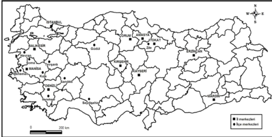
Şekil 2. Geçmişte ve/veya günümüzde leblebi üretiminin önem kazandığı yerleşmelerin dağılışı.

süreçlerinde ortaya çıkmaktadır. Özellikle üretimi perakende satışlara dayanan yerleşmeler için durum böyledir. Zaman içinde yeni yolların yapımı ile ulaşım yapısında oluşan değişimler bazı yerleşmelerde avantajlı durumun yitirilmesine ve leblebiciliğin önemini kaybetmesine yol açmaktadır. Örneğin Havran (Balıkesir)'da yeni yolların ilçe merkezi dışından geçmesi, yıllar içinde nohut üretiminin büyük düşüş göstermesi ile böyle bir süreç yaşanmıştır. Bazen de Seydişehir (Konya)'da olduğu gibi geçim kaynaklarının çeşitlenmesi ve rekabet süreçlerine bağlı olarak leblebiciliğin önemini kaybettiği yerleşmeler söz konusudur. Diğer yandan ulusal perakende pazarında rekabet gücü zayıflayan ancak bu süreci ihracata yönelerek aşmaya çalışan yerleşmeler de bulunmaktadır. Kula (Manisa) ve çalışmada ele alınan Serinhisar (Denizli) ilçeleri bu tür özelliklere sahip yerlerdir.