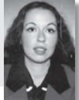
Γράφει η ΜΑΡΙΑ ΤΣΙΚΟΥΛΟΥ

Αχ, τι ωραίες που είναι οι καλοκαιρινές παραθαλάσσιες ταβερνούλες. Αυτή η ανάμικτη μυρωδιά από τα ψάρια που έρχονται ζεστά στο πιάτο μας, σε συνδυασμό με την ευωδιαστή πράσινη πιπεριά, που σχεδόν πάντα στολίζει την Ελληνική σαλάτα, είναι κάτι σαν το ίδιο το καλοκαίρι. Δεν είναι λίγο να μπορείς να έχεις τη δυνατότητα να απολαύσεις έστω μια σαλάτα και δύο-τρία ψάρια, μετρημένα στο πιάτο. Στο πιάτο το λευκό. Πάντα τα πιάτα είναι λευκά σε αυτά τα μικρά ταβερνάκια, λες και θέλουν κάτι να δείξουν, κάτι να προβάλουν. Να προβάλουν ίσως την απλότητα τους και την πολυτέλεια τους, να είναι προσιατά και στον πιο φτωχό πελάτη τους. Είναι τόσο όμορφο πραγματικά και τόσο πολύτιμο το καλοκαίρι, που το ζούμε και για δεύτερη φορά μέσα στο μυαλό μας, αφού αυτό έχει τελειώσει. Το ζούμε μέσα από τις αναμνήσεις και τις κοραλλένιες θύμψεις, του μυαλού μας. Όλα εξάλλου τα όνειρα μας είναι καλοκαιρινά. Δεν θέλουμε την κακοκαιρία του χειμώνα, δεν θέλουμε την καταχνιά. Η συννεφιά είναι κάτι που αναμφίβολα επηρεάζει τη διάθεση μας, γι' αυτό πάντα, μόλις ξεπροβάλει ο ήλιος γινόμαστε αμέσως παιδιά του. Ένα μεγαλειώδες στοιχείο όμως για να τα χαϊρόμαστε όλα αυτά, είναι να έχουμε όλοι την Υγεία μας. Αυτό είναι το σπουδαιότερο από όλα τα άλλα και αρκεί έστω μια σαλάτα. Μια σαλάτα όμως με την Υγείας μας μαζί. Καλό και ευτυχισμένο καλοκαίρι.