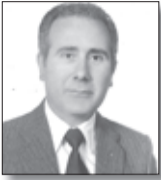
Επίκαιρα Κείμενα ΧΑΤΖΗΠΑΝΤΕΛΗΣ ΠΑΝΑΓ.