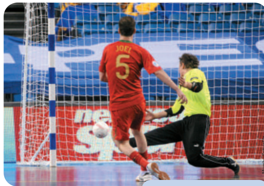
Weissrusslands Torwart Artur Navoichyk ist machtlos gegen den Schuss von Joel, der Portugal mit 2:0 in Führung bringt. Das packende Spiel der Gruppe D in Debrecen endete 5:5 unentschieden.