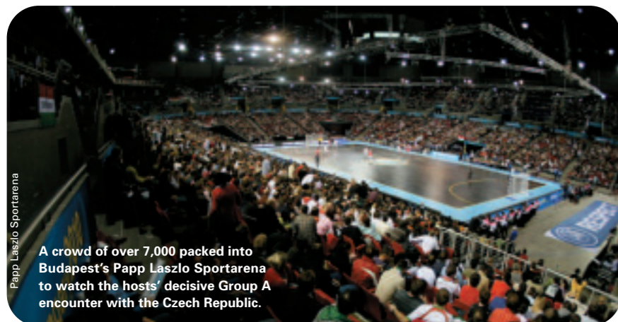
A crowd of over 7,000 packed into Budapest's Papp Laszlo Sportarena to watch the hosts' decisive Group A encounter with the Czech Republic.

The outcome had a familiar look to it. But Hungary 2010 was radically different from the five final tournaments which had preceded it. The expansion to a dozen finalists spread the limelight over a wider spectrum of players and technicians, while the format based on four groups of three and the introduction of quarter-finals gave the event a different sporting and logistical complexion.