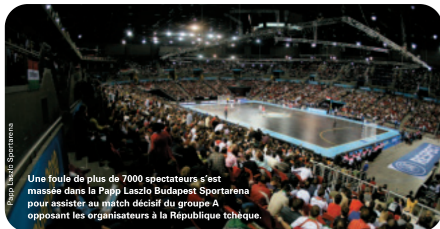
Une foule de plus de 7000 spectateurs s'est massée dans la Papp Laszlo Budapest Sportarena pour assister au match décisif du groupe A opposant les organisateurs à la République tchèque.

L'issue du tour final disputé en Hongrie a certes une certaine similitude avec les cinq tours finaux qui l'avaient précédé mais il a néanmoins été radicalement différent. L'extension à douze finalistes a jeté la lumière sur un plus large spectre de joueurs et de techniciens tandis que la formule s'appuyant sur quatre groupes de trois et l'introduction de quarts de finale a conféré à la manifestation une nature sportive et logistique différente.