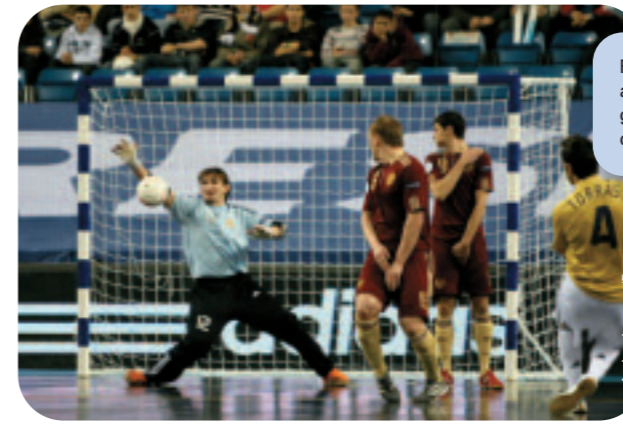
Russia’s defensive wall watches anxiously as Spain’s Jordi Torras tests goalkeeper Sergey Zuev with a free-kick during the goal-less quarter-final.