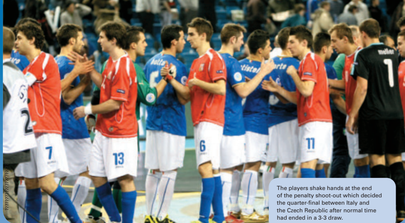
The players shake hands at the end of the penalty shoot-out which decided the quarter-final between Italy and the Czech Republic after normal time had ended in a 3-3 draw.