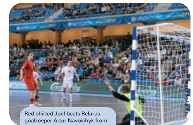
Red-shirted Joel beats Belarus goalkeeper Artur Navoichyk from the penalty spot to bring Portugal back from the brink of elimination to 3-4 during the 5-5 draw between the teams in Group D.