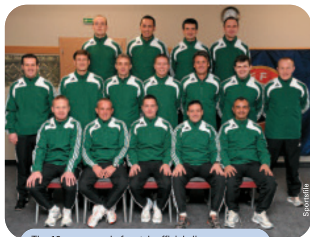
The 16-man squad of match officials lines up for the team photo at their headquarters equidistant from the two centres in Budapest and Debrecen.

Foundations for the first 12-team tournament were laid at the 2007 finals in Porto, where a development blueprint was created. The result was an extensive preparation programme based on educational material, courses and a range of other activities aimed at upgrading levels of futsal refereeing. The 2007 finals provided a fertile source of 'case history' material which was distributed in DVD format to all national associations.