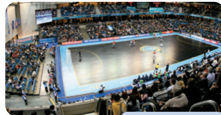
Am letzten Tag des Turniers wohnten zunächst 3 603 Zuschauer dem kleinen Finale zwischen Tschechien und Aserbeidschan (5:3) in der Fönix Arena in Debrecen bei. Für das Endspiel kamen weitere 1 200 Fans hinzu.