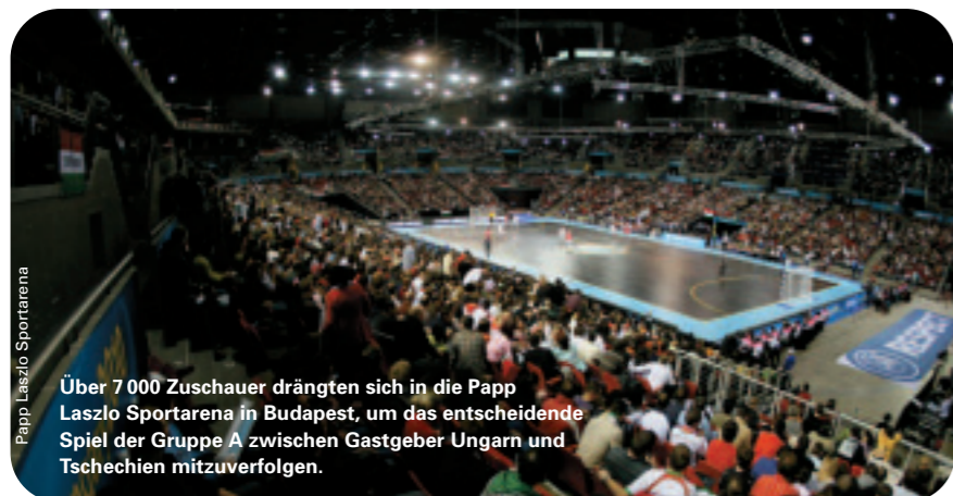
Über 7 000 Zuschauer drängten sich in die Papp Laszlo Sportarena in Budapest, um das entscheidende Spiel der Gruppe A zwischen Gastgeber Ungarn und Tschechien mitzuerleben.

Am Ende war alles wie gewohnt. Und doch war Ungarn 2010 komplett anders als die vorherigen fünf EM-Endrunden. Durch die Erweiterung des Turniers auf zwölf Teams rückten mehr Spieler und Trainer ins Rampenlicht, und durch den Spielmodus mit vier Dreiergruppen und der Einführung von Viertfinalbegegnungen präsentierte sich die Endrunde in sportlicher und logistischer Hinsicht in einem neuen Kleid.