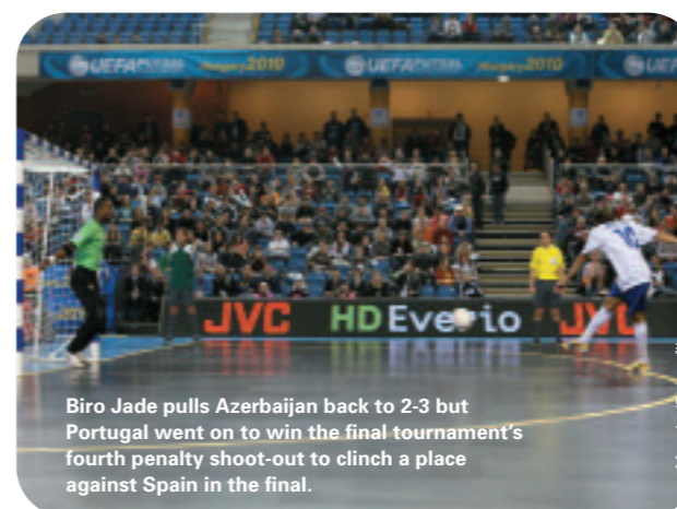
Biro Jade pulls Azerbaijan back to 2-3 but Portugal went on to win the final tournament’s fourth penalty shoot-out to clinch a place against Spain in the final.

One of the tournament anecdotes was that, against Ukraine, Italy’s Cristian Rizzo became the first 18-year-old to appear in the finals. However, at Hungary 2010, experience ruled. Of the 60 most regular starters, 38 had reached or passed the age of 30 – a figure which represents 63% of the ‘workforce’. The starters for champions Spain averaged just over 31 and the Azerbaijan line-up