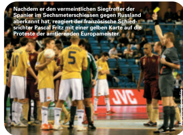
Nachdem er den vermeintlichen Siegtreffer der Spanier im Sechsmeterschiessen gegen Russland aberkannt hat, reagiert der französische Schiedsrichter Pascal Fritz mit einer gelben Karte auf die Proteste der amtierenden Europameister.