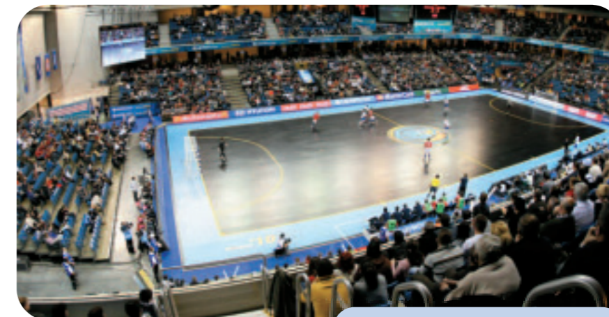
On the final day, there was a crowd of 3,603 to watch the Czech Republic beat Azerbaijan 5-3 to take the bronze medal, with a further 1,200 fans coming in to watch the final at the Fönix Arena in Debrecen.