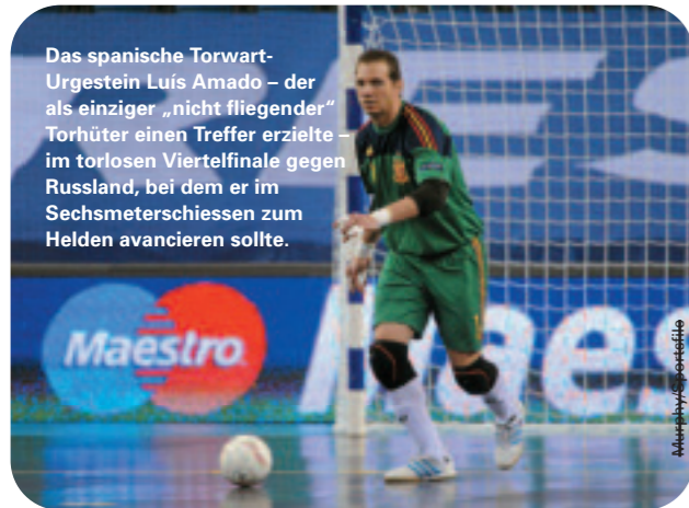
Das spanische Torwart-Urgestein Luis Amado – der als einziger „nicht fliegender“ Torhüter einen Treffer erzielte – im torlosen Viertelfinale gegen Russland, bei dem er im Sechsmeterschiessen zum Helden avancieren sollte.