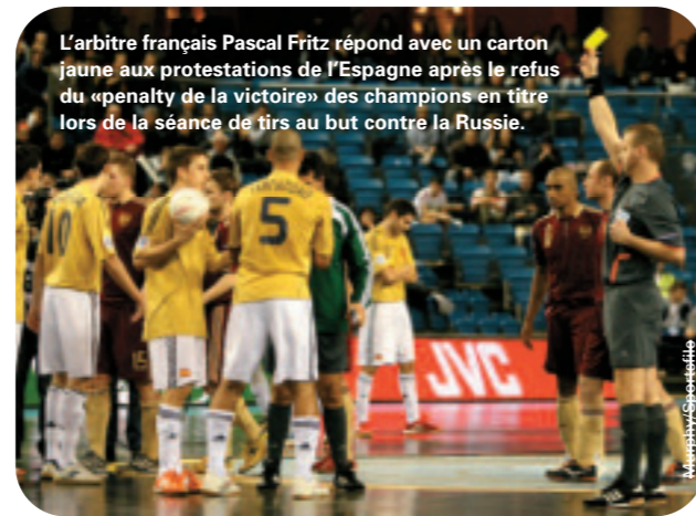
L'arbitre français Pascal Fritz répond avec un carton jaune aux protestations de l'Espagne après le refus du «penalty de la victoire» des champions en titre lors de la séance de tirs au but contre la Russie.