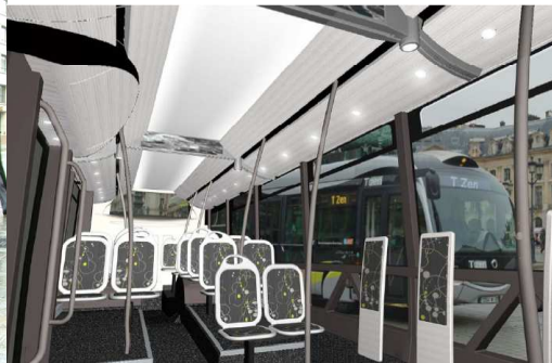
Habillage intérieur (avec éclairage indirect au plafond et lumière d'ambiance)