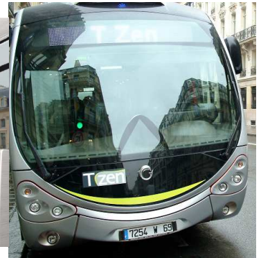
Désign extérieur spécifique