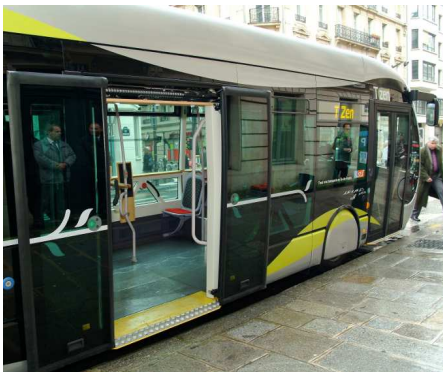
Portes à ouverture latérale