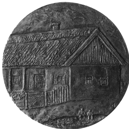
Cséri Lajos: Nagymama háza

Munkásságát külföldön szinte jobban ismerik, mint idehaza. Dürer-érmét Nürnbergben, Van Gogh-plakettjét Amszterdamban őrzi a múzeum. Amerikában és Japánban a legjelentősebb magángyűjtők kincsként emlegetik munkáit. Egy esztendeig New York állam Cortlandi egyetemének művészeti tanszékén portré, érem és kisplasztika készítését tanította.