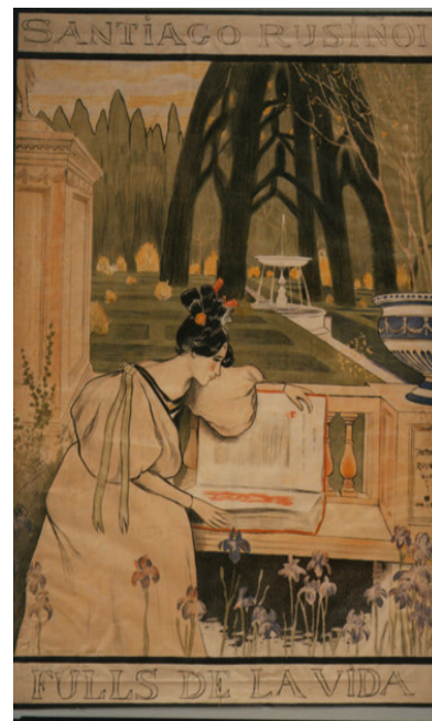
Santiago Rusiñol, Fulls de la vida