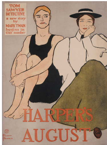
Edward Penfield. Harper's August. Tom Sawyer Detective , 1896 Col·lecció Plandiura, adquirida el 1903