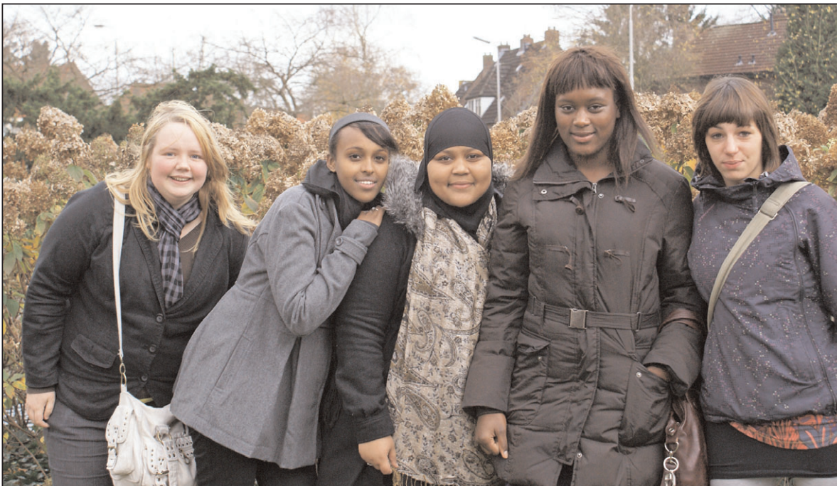
Er deden dit jaar veel jongeren mee aan de Dag van de Dialoog

Veel mensen in Amersfoort hebben behoefte om elkaar te ontmoeten en samen te praten over hun eigen ervaringen in hun wijk en de stad. In een tijd waarin verschillende bevolkingsgroepen steeds meer tegenover elkaar lijken te komen staan, zijn deze positieve krachten nodig. Daarom organiseerde de Stichting Welzijn Amersfoort (SWA) dit jaar voor de derde keer de Dag van de Dialoog. Dit in opdracht en met ondersteuning van de gemeente. Jong en oud, arm en rijk, wit en gekleurd, gezond en ziek wisselde met elkaar in een veilige sfeer van gedachten. Hierdoor is bij de deelnemers meer begrip voor elkaar ontstaan. Bijzonder aan deze derde Dag van de Dialoog was, dat er veel meer jongeren meededen dan afgelopen jaren.