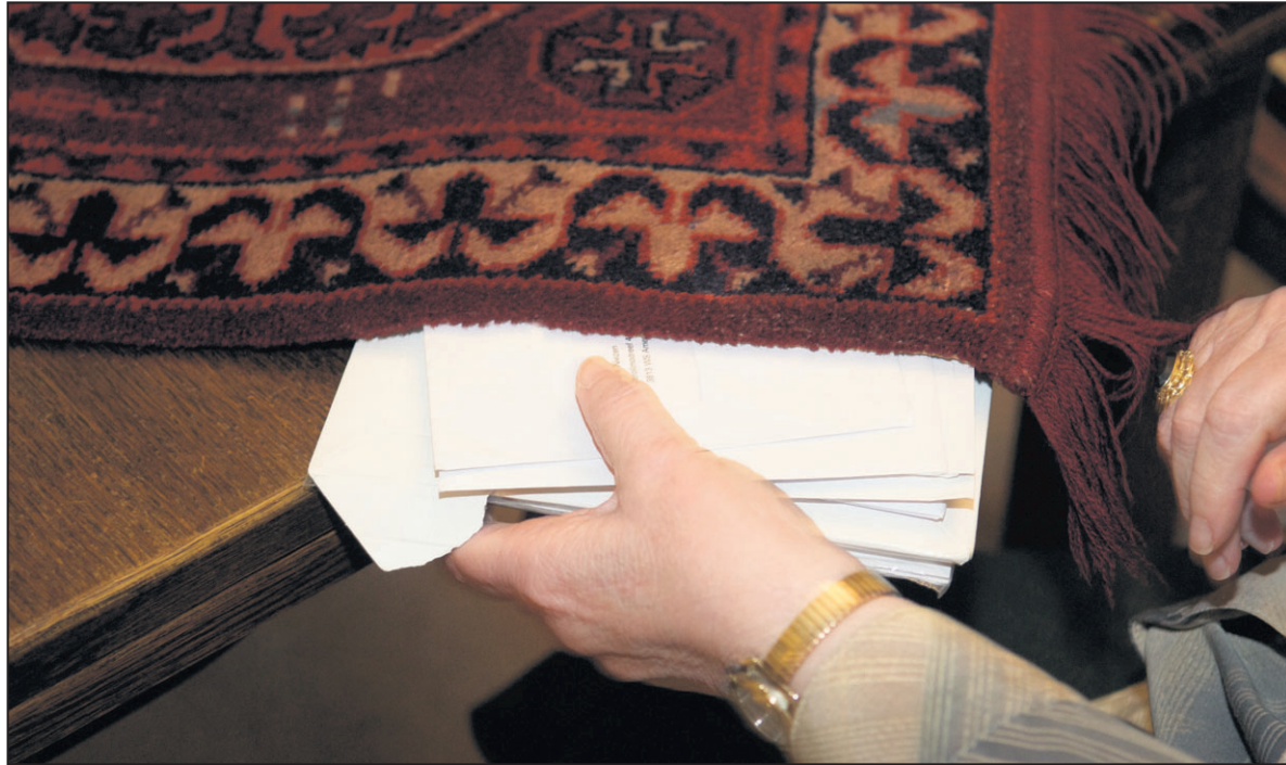
Ook het achterhouden van post kan een vorm van mishandeling zijn.

Voor meer informatie via internet gaat u naar: www.huiselijkgeweld-eemlandheuveelrug.nl . Bij acuut gevaar belt u het alarmnummer 112 (politie, ambulance). Ook vindt u informatie over ouderenmishandeling op de websites www.huiselijkgeweld.nl en www.movisie.nl/ouderenmishandeling .