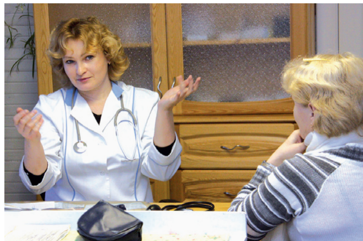
Сельский доктор в работе

Сельская медицина издавна была и является одним из критериев оценки состояния здоровья государства. Для архангельской глубинки фельдшерско-акушерский пункт (ФАП) - единственная учреждение, где жители могут получить квалифицированную медицинскую помощь. Сегодня ФАП - это и терапевт, и хирург, и социальный работник для стариков. От того, какой диагноз поставит сельский врач, часто зависит дальнейшая жизнь человека.