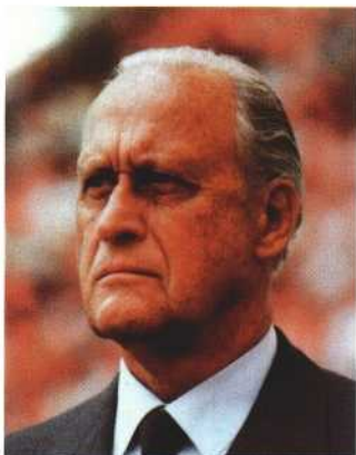
Dr. João Havelange (Brazil) FIFA President

Überaus erfreulich gestaltete sich das Turnier selbst. Neben den Fussballgrossmächten wie Brasilien oder auch England traten vor allem Ghana und die australischen Gastgeber als Mannschaften auf, deren Spielern ebenfalls die Zukunft des Fussballs gehören könnte. Ich bin überzeugt, dass Australien für einige der hoffnungsvollen Akteure der Anfang einer gros-