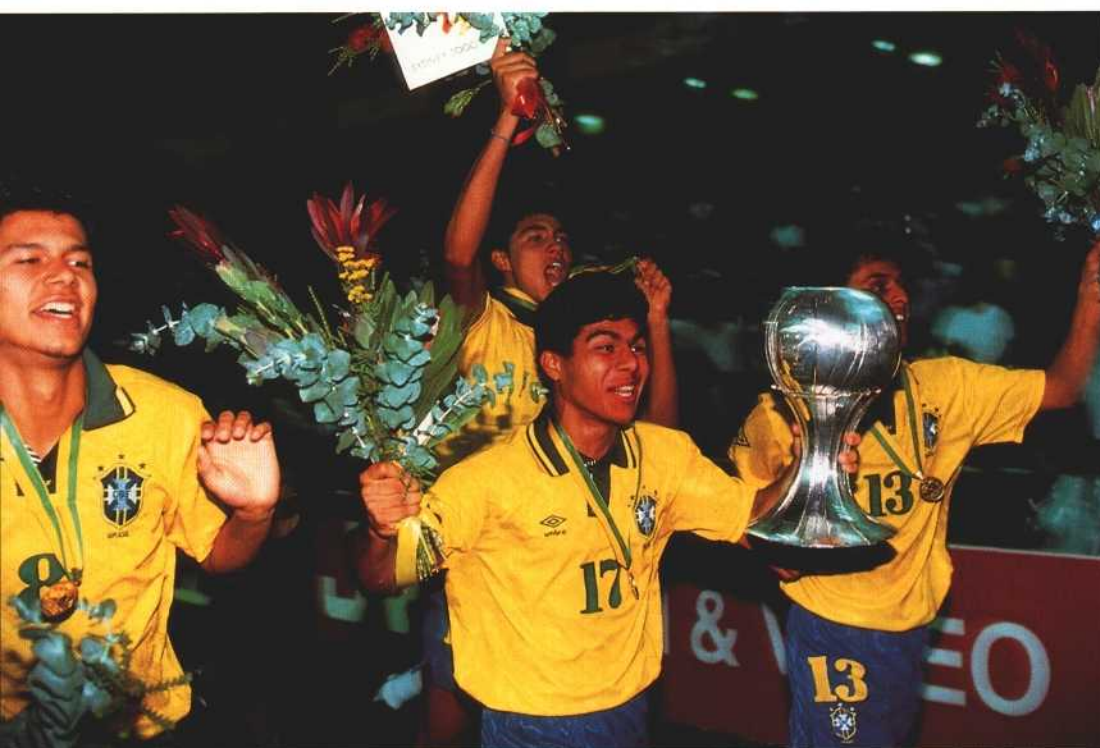
The jubilant Brazilians doing the rounds on the pitch after collecting the Cup.

A Hollywood producer could not have come up with more drama. With extra time and the prospect of "sudden death" that was being tested