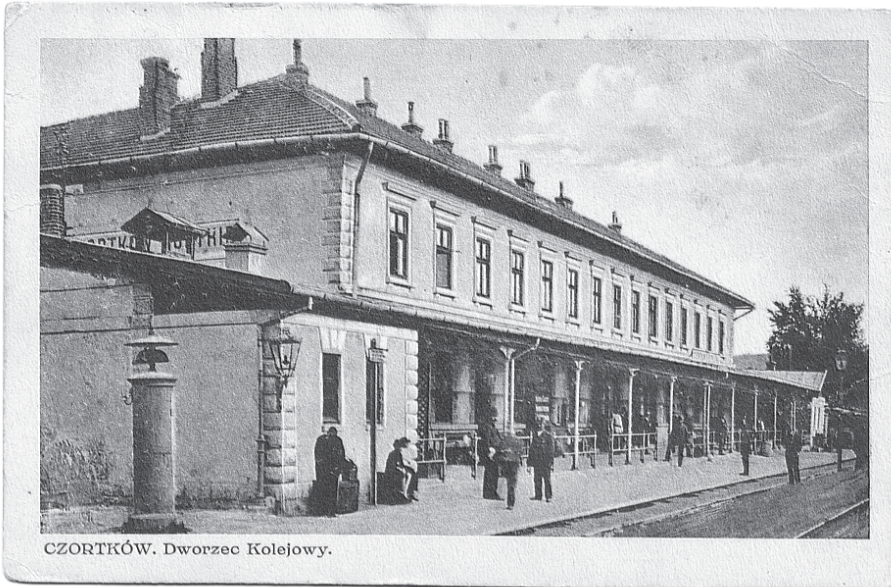
CZORTKÓW. Dworzec Kolejowy.

За 76 км на південь від Тернополя, в мальовничій долині річки Серет, яка біжить глибоким каньоном, який утворили води колись теплого Сарматського моря, лежить місто Чортків. Воно здавна має два битих шляхи: один з них роздвоюється і через Білобожницю веде до Бучача та Івано-Франківська, а на південь через Ягільницю, Товсте – до Заліщиків