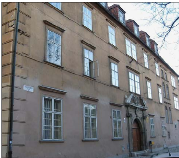
Historická budova Rímskokatolíckej cyrilometodskej bohosloveckej fakulty UK stojí na Kapitulskej ulici vedľa Dómu sv. Martina.

RKCMBF bola zriadená osem mesiacov po prvej svetovej vojne, a to 24. júla 1919, keď spadala pod správu Univerzity Komenského. Po nástupe komunizmu, ktorý potlačal náboženstvo a jeho výučbu, bola z tohto zväzku v roku 1946 – 1947 vyňatá. Našťastie pre všetkých, ktorí majú záujem o štúdium náboženstva, sa 14. júla 1950 zaviedla nová organizácia bohosloveckého štúdia. Po páde komunizmu, presnejšie 3. mája 1990 bola táto fakulta znovu začlenená do zväzku s UK.