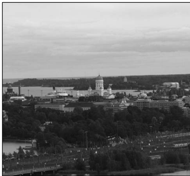
Helsinki boli dejiskom konferencie o doktorandskom štúdiu lekárskech smerov.

Prítomní konštatovali, že klinické pracoviská, najmä v spolupráci so základnými a predklinickými odborníkmi, sú miesta, kde sa dajú kvalitne vychovávať doktorandi. Preto v dokumente „Helsinki Consensus Statement on PhD. Training in a Clinical Setting“, uverejnenom aj na stránke www.orpheus-med.org odporučili, aby sa na všetkých lekárskech fakultách v EÚ rozvíjalo PhD. štúdium aj na klinických pracoviskách.