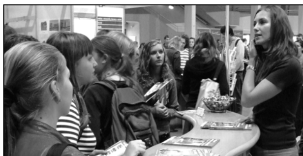
Veľtrhy vzdelávania sú výbornou možnosťou propagácie štúdia

Potvrdilo sa, že na veľtrh AKADÉMIA chodia študenti stredných škôl v hojnom počte z celého Slovenska a hľadajú konkrétne odpovede na možnosti štúdia na rôznych školách. Časť z nich už má predstavu, čo a kde by chceli študovať a hľadajú priamo stánok vyhladanej školy.