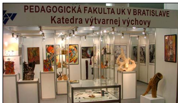
Kolekcia vystavených diel siahala od výtvarného umenia, cez úžitkovú keramiky i šperky

Oveľa širšiu pôsobnosť i dosah však mala reprezentatívna výstava, výber z diel študentov i absolventov katedry (zastúpené boli aj diplomové práce), ktorá sa uskutočnila v bratislavskej Inchebe v rámci 6. Medzinárodnej výstavy výtvarného umenia ART 2007 a veľtrhu MODDOM. Táto výstava trvala síce krátko (17. – 22. októbra 2007), ale navštívili ju záujemcovia z celého Slovenska.