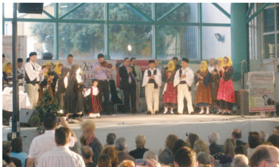
Και το γλέντι άρχισε...