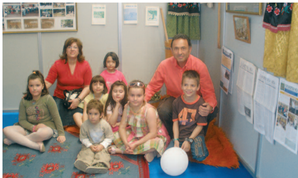
Από τους πρώτους επισκέπτες ένα Δημοτικό Σχολείο του Περιστερίου