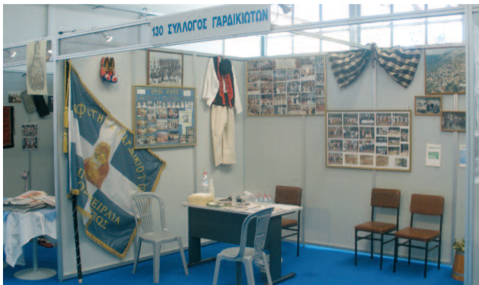
Το περίπτερο έτοιμο από την Παρασκευή το πρωί