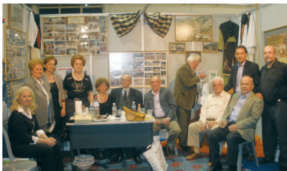
Σάββατο βράδυ και το περίπτερο γέμισε επισκέπτες