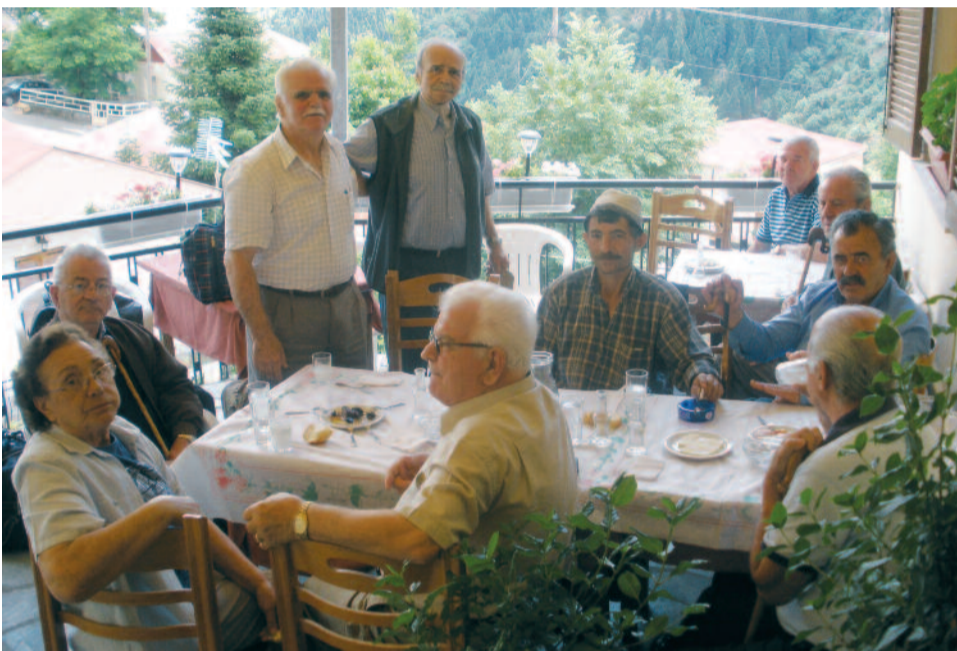
Τελευταία τσίπουρα πριν το δρόμο της επιστροφής