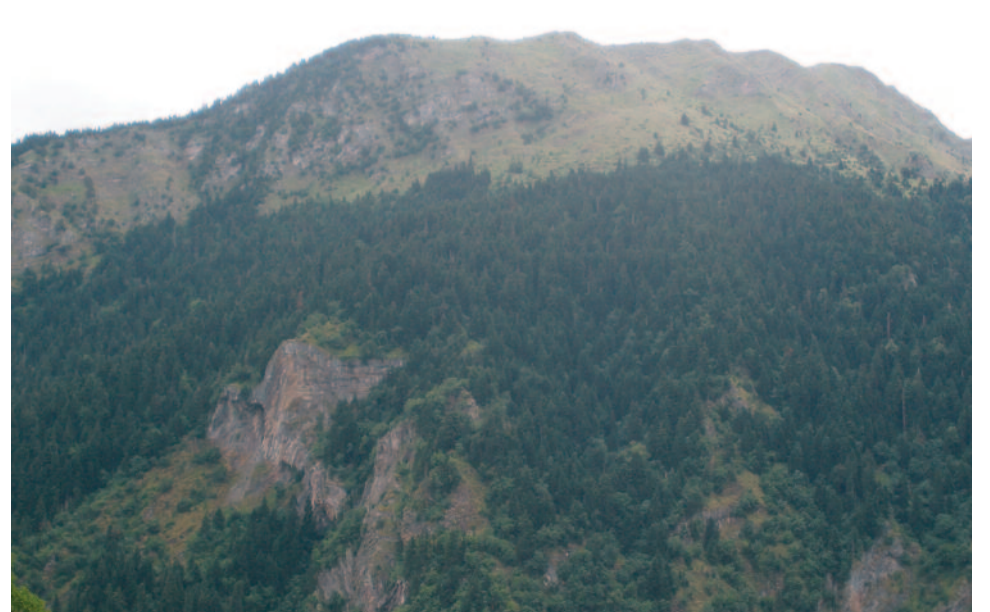
Ακόμα και βράχια είχαν πρασινίσει