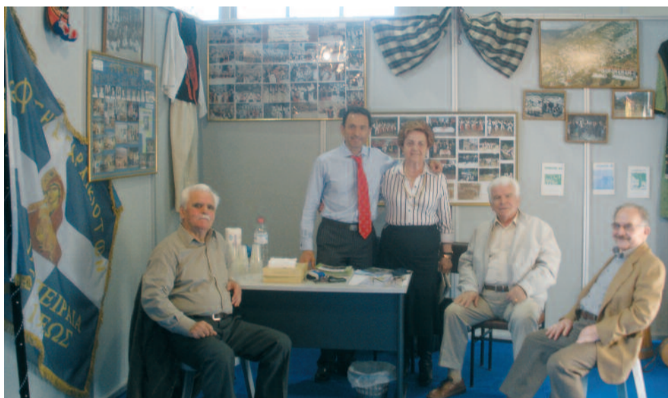
Οι πρώτοι δικό μας επισκέπτες