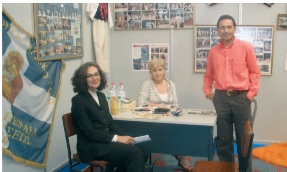
Το περίπτερο επισκέφτηκε και η πρώην πρωταθλήτρια και νυν Βουλευτής Σοφία Σακοράφα