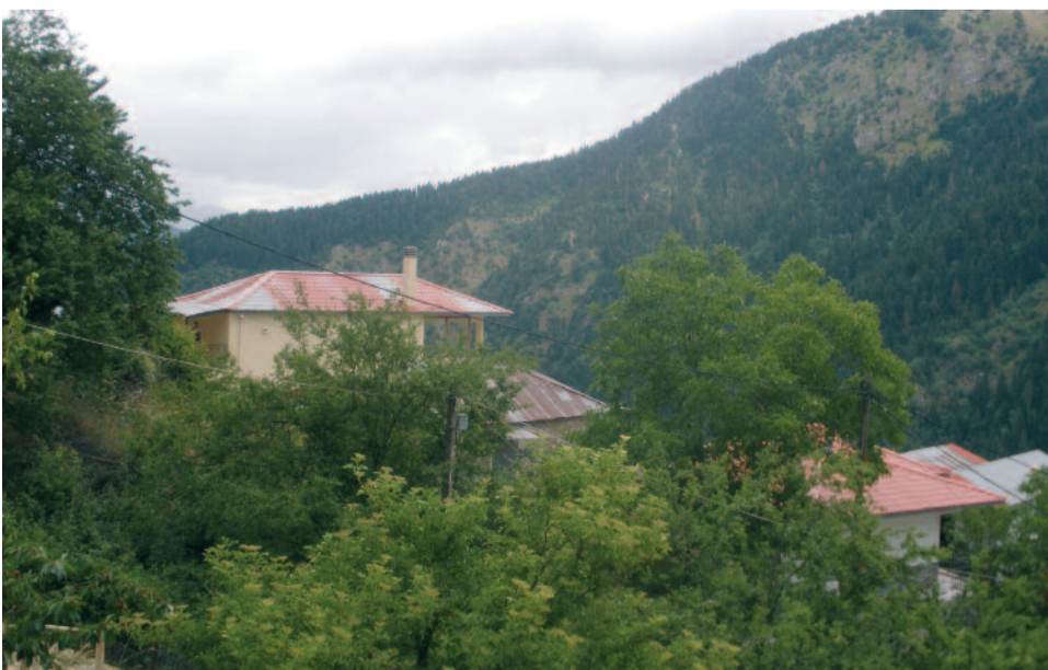
Πνιγμένο στο πράσινο το χωριό απ' τα πολλά νερά του χειμώνα