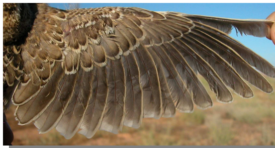
Calandria común. Juvenil: diseño del ala (06-VII)