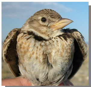
Calandria común. Diseño del pecho: arriba adulto (07-VII); abajo juvenil (06-VII)