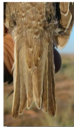
Calandria común. Diseño de la cola: izquierda adulto (07-VII); derecha juvenil (06-VII)