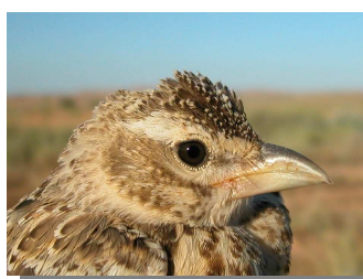
Calandria común. Diseño de la cabeza: arriba adulto (07-VII); abajo juvenil (06-VII)