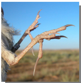
Calandria común. Color de las patas: izquierda adulto (07-VII); derecha juvenil (06-VII)