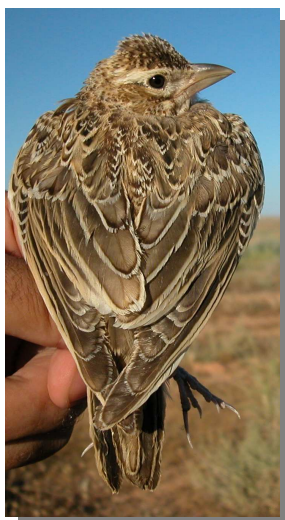
Calandria común. Diseño del dorso: izquierda adulto (07-VII); derecha juvenil (06-VII)