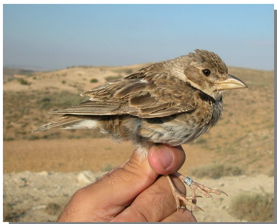
Calandria común. Adulto (27-VII).