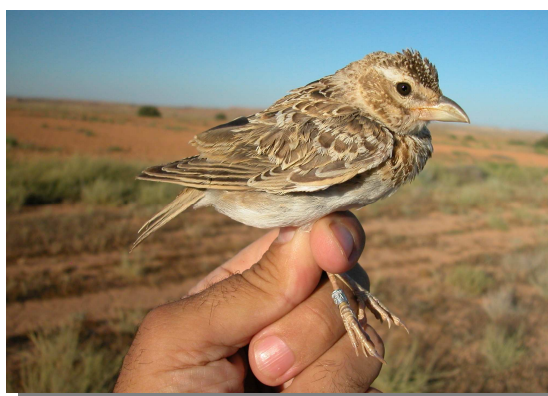
Calandria común. Juvenil (06-VII)

Sedentaria. Presente en todas las grandes llanuras del Valle del Ebro y del Sistema Ibérico.