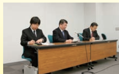
12月9日(金) 栃木県庁内での記者会見の様子

県域放送では、県民の皆様にとって関心の高い、地域に密着したニュースや生活情報をていねいにお伝えします。特に災害時は、被害を防ぐためにきめ細かい防災報道を行います。選挙・スポーツ・事件・行政・産業・暮らしなどに関わるさまざまな情報をこれまで以上にくわしくお伝えする方針です。また、県域放送と並行して今後も栃木県の情報を関東全域や全国向けに積極的に発信していきます。