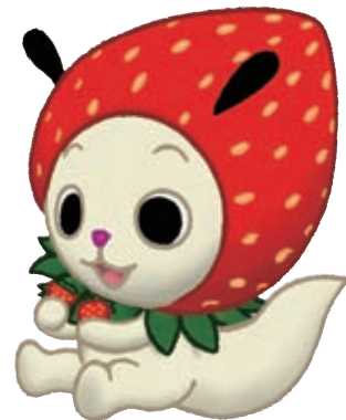
いちごなみちゃん