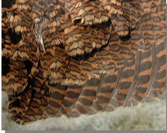
Chocha perdiz. 1º año: diseño de secundarias (16-XII).