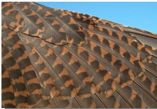
Chocha perdiz. 1º año: diseño de coberteras primarias (16-XII).