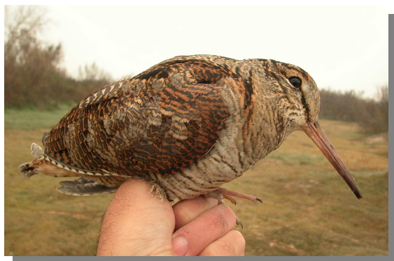
Chocha perdiz (23-XII).