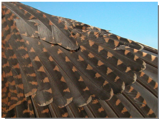
Chocha perdiz. Adulto: diseño de coberteras primarias (16-XII).