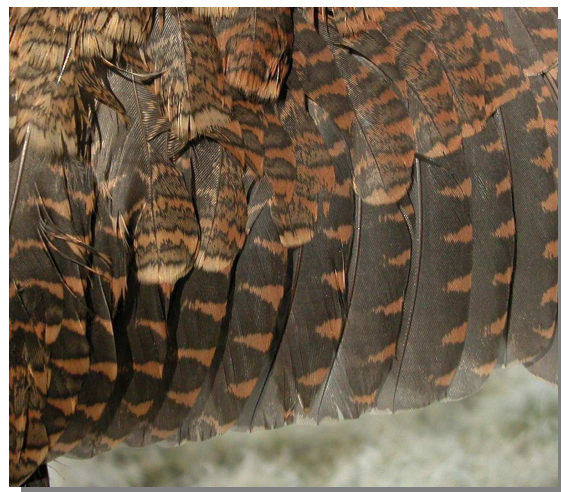
Chocha perdiz. Adulto: diseño de secundarias (16-XII).