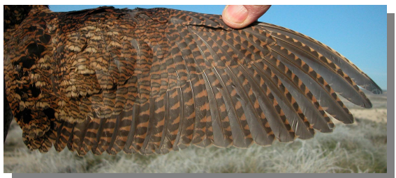
Chocha perdiz. 1º año: diseño del ala (16-XII).