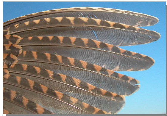
Chocha perdiz. 1º año: diseño de primarias (16-XII).