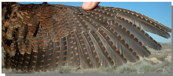
Chocha perdiz. Adulto: diseño del ala (16-XII).