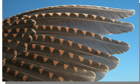
Chocha perdiz. Adulto: diseño de primarias (16-XII).