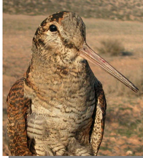
Chocha perdiz. Diseño del pecho y dorso (23-XII).