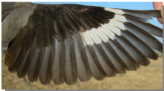
Alcaudón chico. Verano. Hembra: diseño del ala (11-VII).