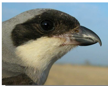
Alcaudón chico. Verano. Hembra: diseño de la cabeza (11-VII).

Especie estival. Nidificante muy escaso y localizado en el oriente de la provincia de