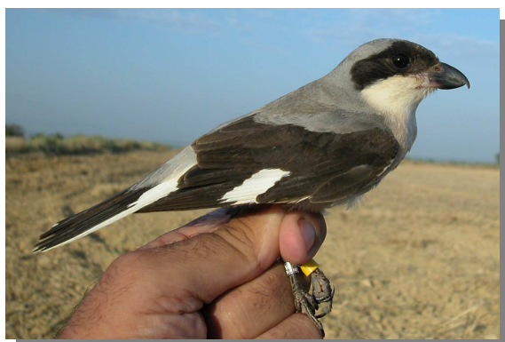
Alcaudón chico. Verano. Hembra (11-VII).