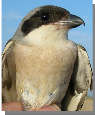
Alcaudón chico. Verano. Hembra: diseño del pecho (11-VII).