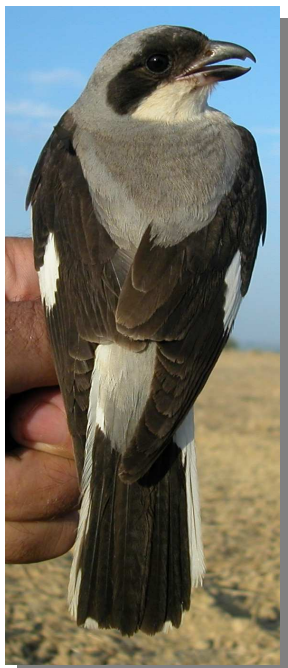
Alcaudón chico. Verano. Hembra: diseño del dorso (11-VII).