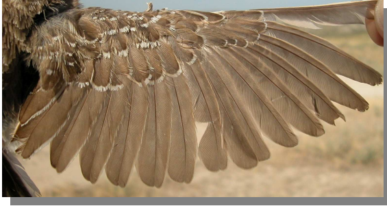
Terrera marismeña. Juvenil: diseño del ala (28-VI).