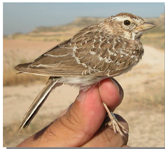
Terrera marismeña. Juvenil (28-VI)

Especie sedentaria restringida a las zonas de vegetación esteparia del Valle del Ebro.