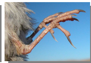
Terrera marismeña . Color de las patas: izquierda adulto (04-V); derecha juvenil (06-VII).