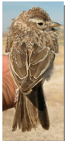
Terrera marismeña . Diseño del dorso: izquierda adulto (04-V); derecha juvenil (28-VI)