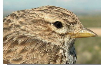
Terrera marismeña . Diseño de la cabeza y pico: arriba adulto (04-V); abajo juvenil (28-VI)