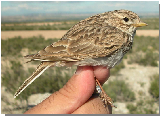
Terrera marismeña. Adulto (04-V).

TERRERA MARISMEÑA ( Calandrella rufescens )