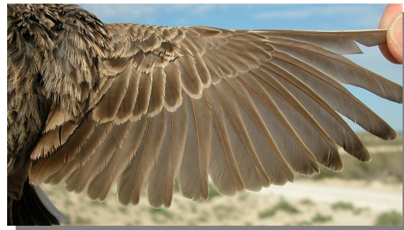
Terrera marismeña . Adulto: diseño del ala (04-V).