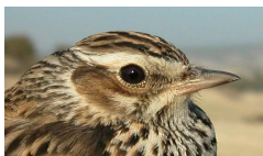
Arriba terrera común adulto y juvenil; izquierda totovía.