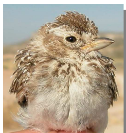
Terrera marismeña . Diseño del pecho: izquierda adulto (04-V); derecha juvenil (28-VI)