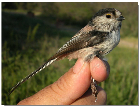
Mito. Adulto (15-V).