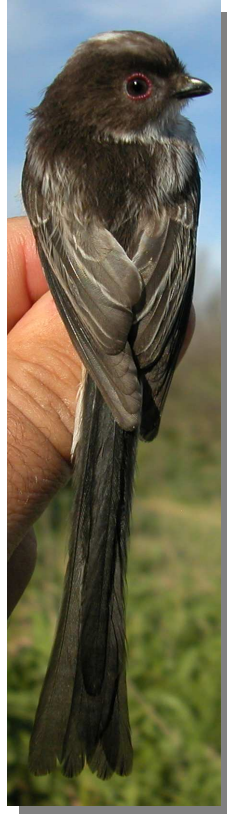
Mito. Diseño del dorso: izquierda adulto (15-V); derecha juvenil (15-V).