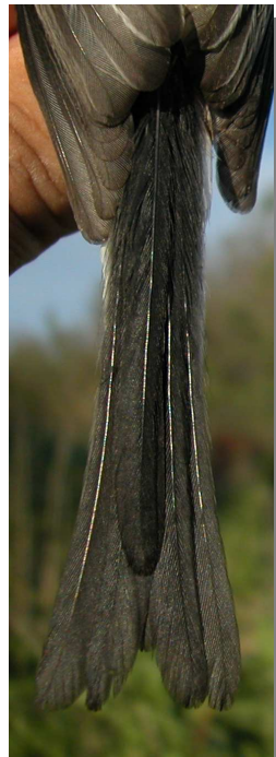
Mito. Longitud de las plumas centrales de la cola: izquierda adulto (15-V); derecha juvenil (15-V).