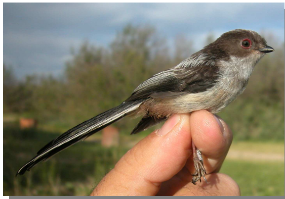
Mito. Juvenil (15-V).

Sedentario, con aporte de aves europeas en los inviernos crudos. Ampliamente repartido por toda la Comunidad en las áreas con arbolado.