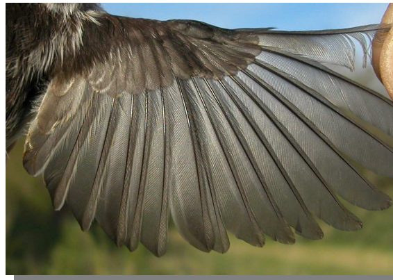
Mito. Juvenil: diseño del ala (15-V)