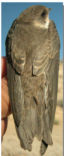
Avión zapador. Diseño del dorso: arriba izquierda en primavera (09-IV); arriba derecha adulto en verano (31-VII); izquierda juvenil (22-VII).