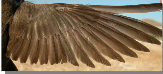
Avión zapador. Verano. Adulto: diseño del ala (31-VII).