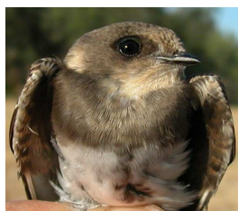
Avión zapador. Diseño del pecho: arriba izquierda en primavera (09-IV); arriba derecha adulto en verano (31-VII); izquierda juvenil (07-VII).