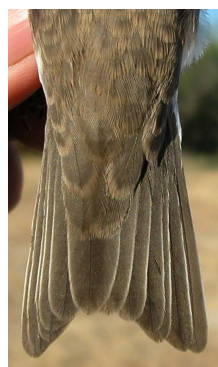
Avión zapador. Diseño el obispillo y desgaste de la cola: arriba izquierda en primavera (09-IV); arriba derecha adulto en verano (31-VII); izquierda juvenil (07-VII).