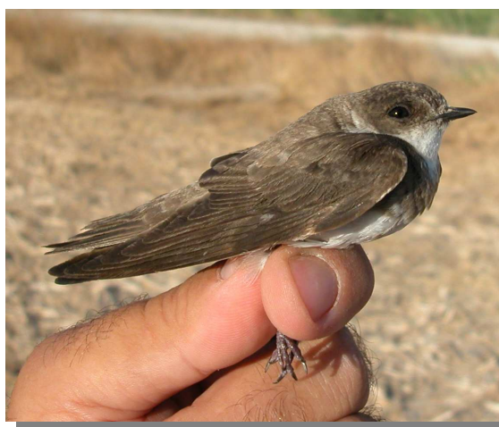
Avión zapador. Verano. Adulto (31-VII)

Especie estival, ligada principalmente al Ebro y con colonias en algunos ríos del Pirineo y el tramo medio del río Martín.