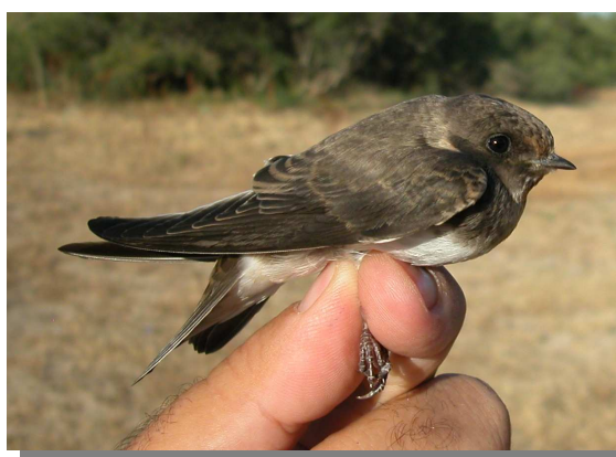
Avión zapador. Verano. Juvenil (22-VII).