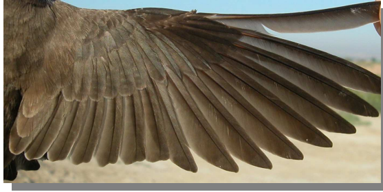
Avión zapador. Primavera: diseño del ala (09-IV).