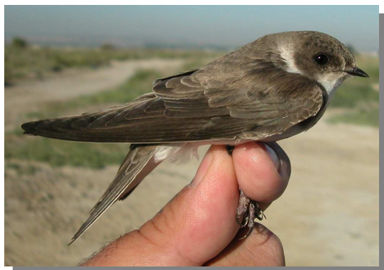
Avión zapador. Primavera (09-IV).