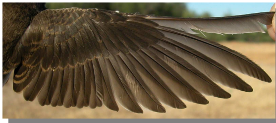
Avión zapador. Juvenil: diseño del ala (07-VII).