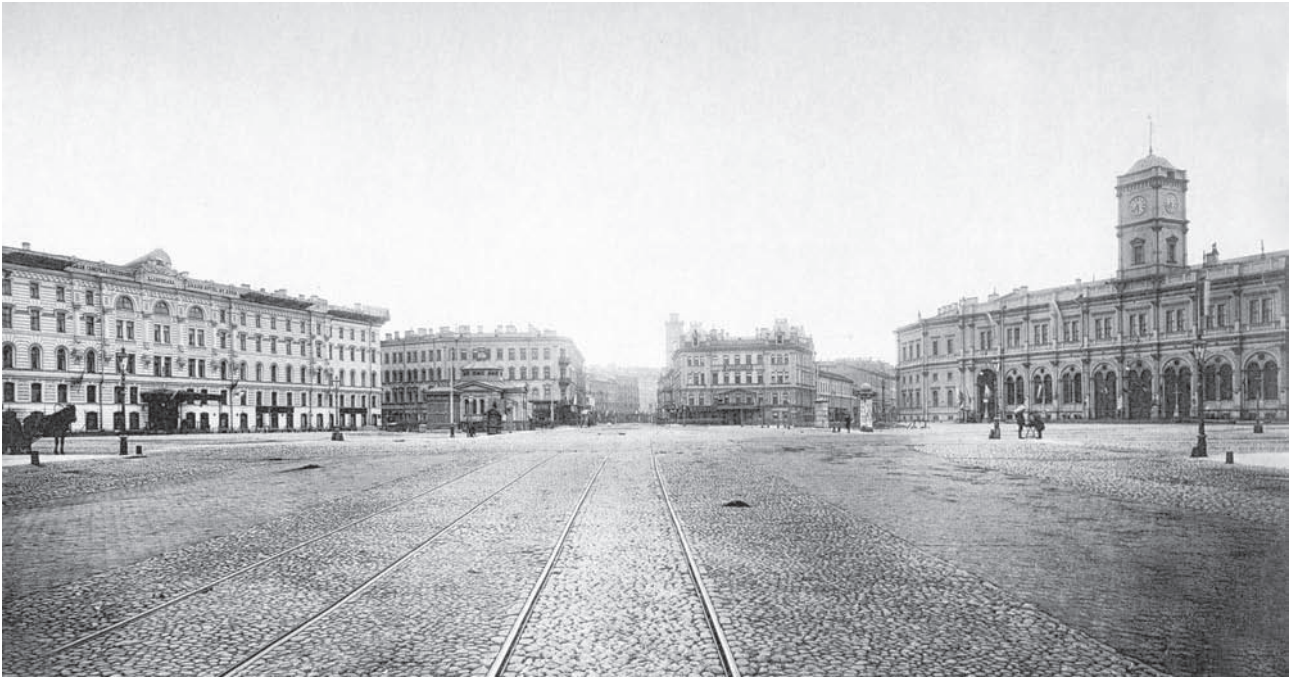
Знаменская площадь. 1890-е гг. Инв. ЭРФТ-152

тов чертежей 1845 года по устройству пассажирской станции в Петербурге подписаны Желязевичем). С 1847 года Тон не принимал участия в строительстве вокзала.