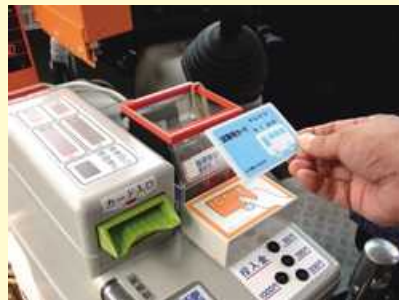
1. 乗車時、整理券機下の読取部にかざす