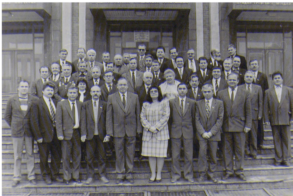
Депутатский корпус первого созыва Верховного Совета ПМССР

Нужно сказать, что с самого начала 1991 года в молодой республике предпринимались шаги по созданию собственной финансовой и банковской систем. В это время на территории Приднестровья функционировали более 20 акционерно-коммерческих банков – филиалов специализированных банков Молдовы. Между тем в Москве была достигнута договоренность о создании в Приднестровье регионального банка на базе существующего отделения Агропромбанка СССР с его прямым подчинением правлению Агропромбанка СССР. В апреле Верховный Совет принял решение: предприятия