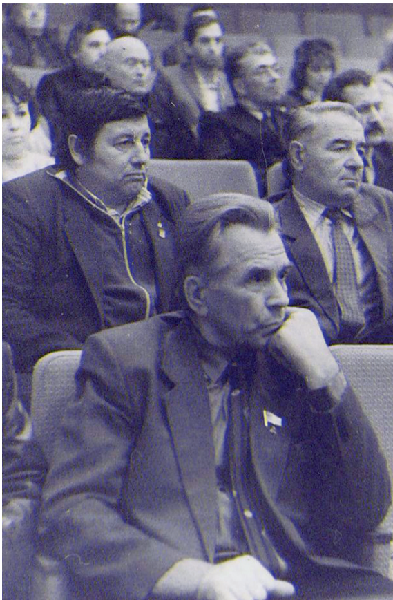
На сессии Верховного Совета первого созыва

и организации должны прекратить отчисления в бюджет Молдовы. Средства начали направляться на счета нового приднестровского банка.