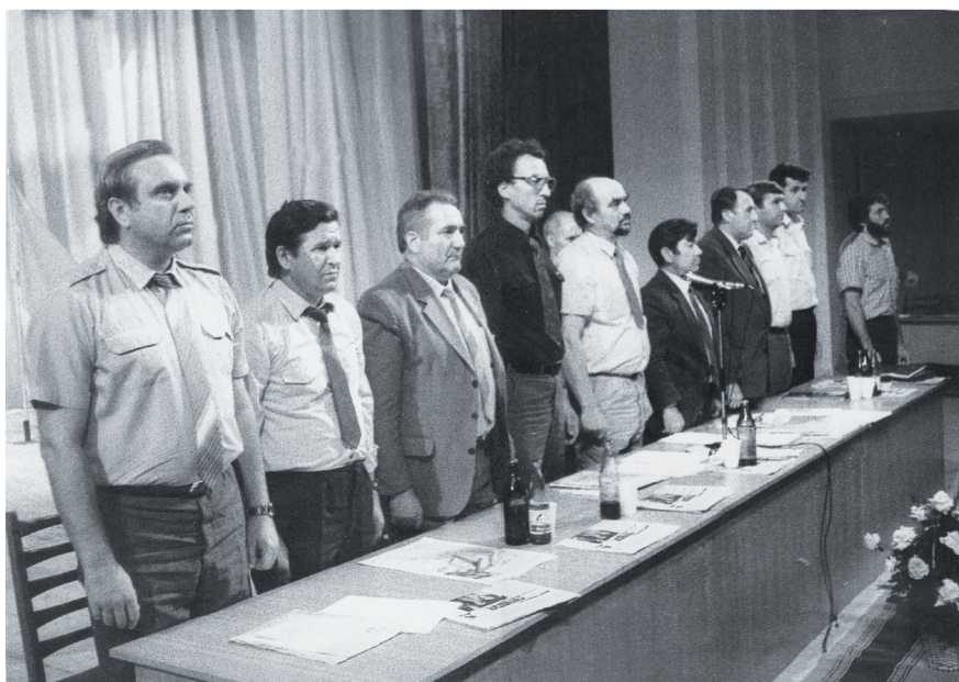
1 съезд депутатов всех уровней.