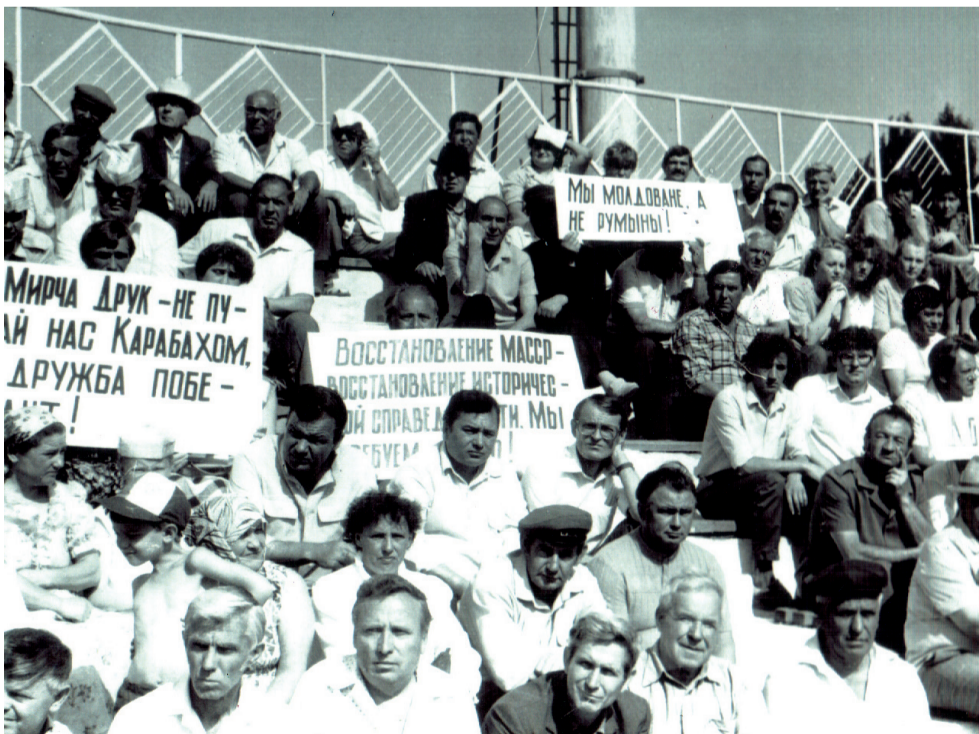
Сход граждан пос. Каменки на стадионе "Октябрь". 15 июля 1990 г.