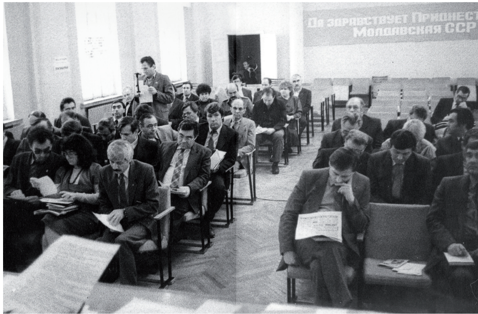
Первая сессия первого созыва депутатов Верховного Совета ПМССР. 29 ноября 1990 г.

В конце января 1991 года своим постановлением Верховный Совет создает комиссию по формированию органов госуправления. Работают де-