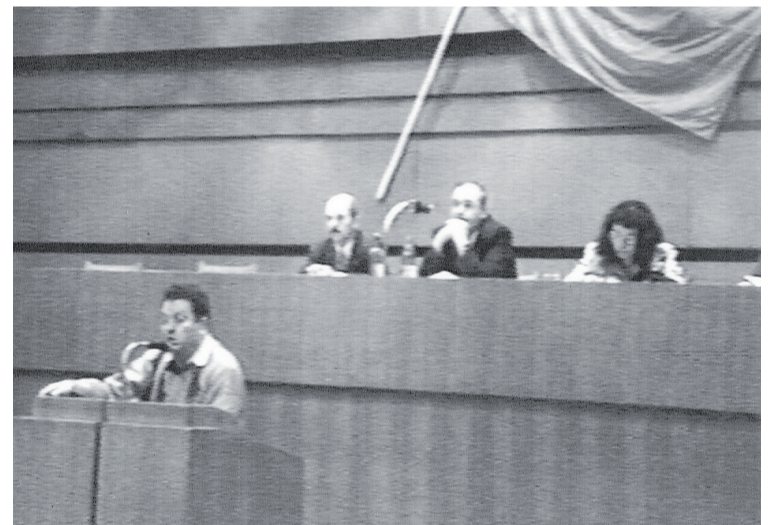
На одном из заседаний сессии депутатов первого созыва

22-25 ноября. 63 округа. Вокруг – политическое давление. Но жители региона придут и проголосуют, подтвердят свою позицию и выбранное направление своего развития. 81% избирателей – выборы в первый Верховный Совет ПМССР состоялись. А вместе с ними были исчерпаны и полномочия Временного