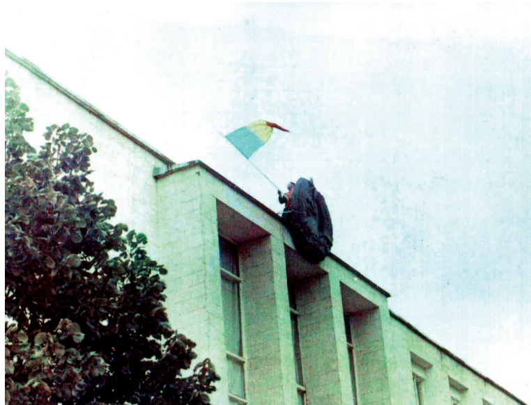
Снятие триколора со здания райисполкома. Каменка, 27 мая 1990 г.

Горсоветы Тирасполя, Бендер, Рыбницы и райсовет Слободзеи отказались признавать и вывешивать румынский флаг.