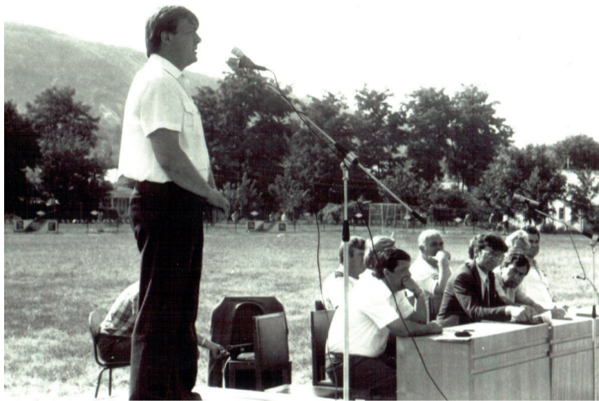
На сходе граждан выступает народный депутат ССРМ А. Н. Бут

Верховный Совет МССР констатировал, что съезд депутатов Приднестровья и решение о создании территории с органами государственной власти и управления являлись антиконституционным актом. И внес изменения и дополнения в Уголовный кодекс, прописав, что за «антимолдавскую» пропаганду и неповиновение власти наказание составит до 10 лет лишения свободы и до 5 лет ссылки.