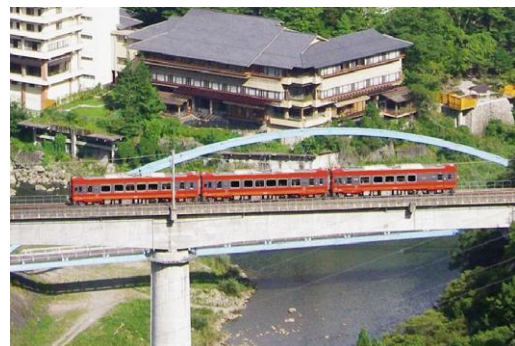
△「AIZUマウントエクスプレス号」