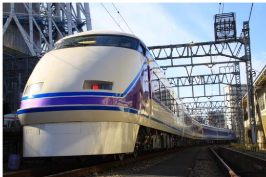
△特急「スペーシア」（リニューアル車両）