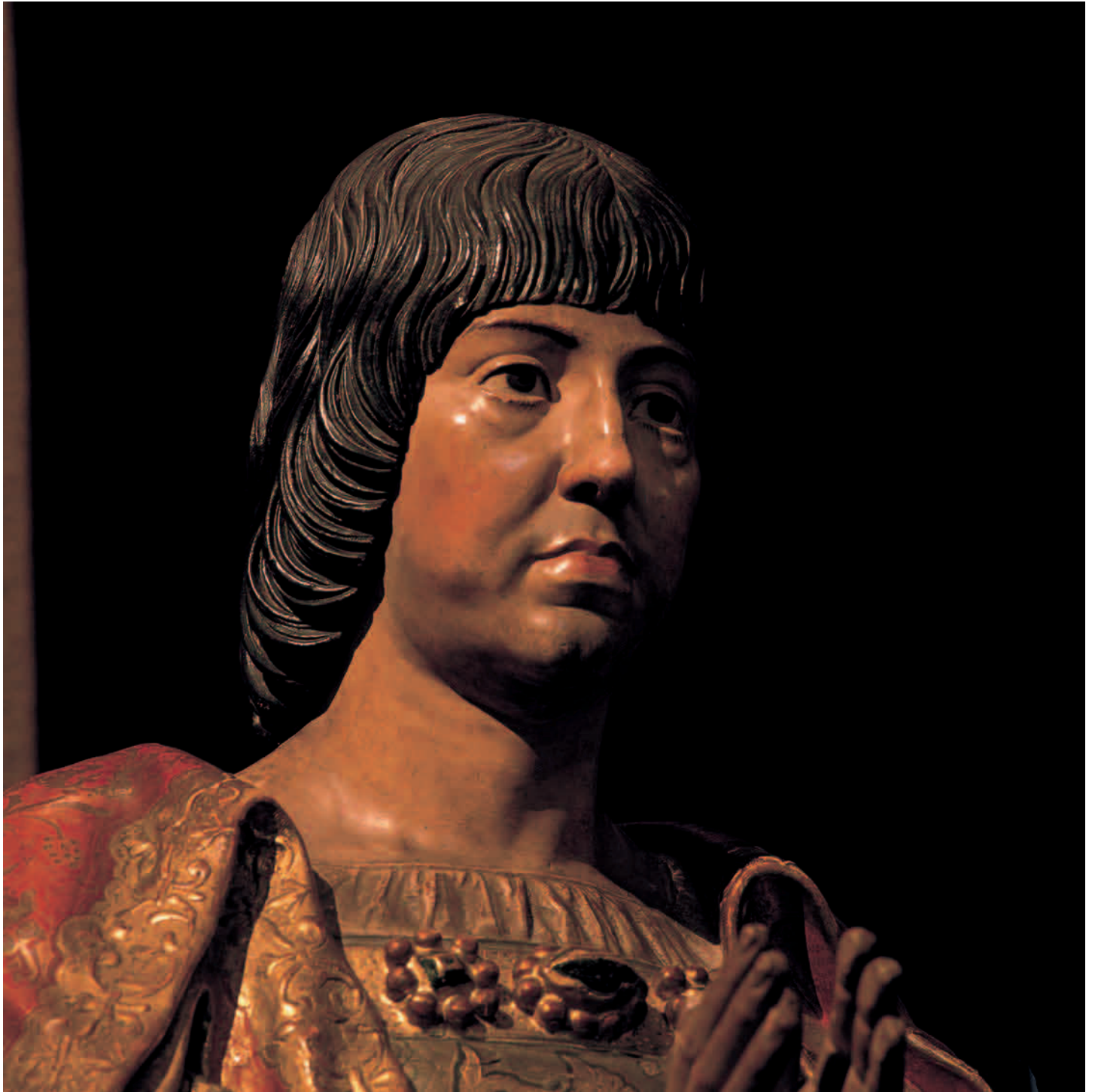
Felipe Vigarny Estatua de Fernando el Católico (detalle). CAPILLA REAL DE GRANADA