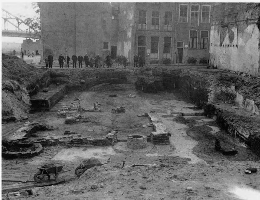
Opgaving van een tufsteen huis aan de Polstraat in 1948

koopmansgilde, omdat zij de belangrijkste burgers waren. Het woord koopmansgilde is misleidend. In de eerste plaats is met koopman niet de koopman in de brede zin van het woord bedoeld, maar de lakenkoper of wantsnijder, wat suggereert dat de lakenhandel in de 13de en 14de eeuw in Deventer de belangrijkste economische activiteit was. Bovendien waren ook andere Deventernaren uit de elite lid van dit gilde, zelfs geestelijken. Zo'n gilde behartigde immers de belangen van de burgerlijke elite. Het had een eigen statuut met regels waaraan de leden zich moesten houden. Wanneer het Deventer koopmansgilde is ontstaan, is onbekend, maar het moment waarop het zich voor het eerst schriftelijk manifesteerde wel: 1249. In dat jaar lieten zeventig leden zich door een geestelijke van de St. Lebuïnuskerk registreren op papieren die bewaard zijn gebleven in de vorm van een rol van 621 centimeter. Die bevat 1.455 namen, bijgehouden tot 1387 en bekend gebleven als de koopmangilderol.