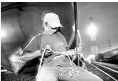
Un migrante centroamericano se amarra a un tren para atravesar territorio mexicano, en imagen de archivo 11

“Como lo atestigua el rescate de 200 migrantes centroamericanos (con su saldo de 5 muertos), atrapados en un vagón de tren cerca de Palenque, en abril de 2000, la migración internacional, especialmente en este espacio fronterizo se ha vuelto de alto riesgo (La Jornada, 13 de abril de 2001, pág. 45). Este incidente no es ni excepcional ni fortuito... En los últimos años la región divisoria entre México y Guatemala se ha convertido en uno de los cruces más difíciles y azarosos para los migrantes indocumentados, la mayoría proveniente de Guatemala, Honduras, El Salvador y Nicaragua. Ahí la multiplicidad de amenazas que enfrentan, incluyendo el asalto, el robo y los accidentes, por nombrar sólo algunas, hacen que esa región resalte precisamente por el alto riesgo que representa para los que intentan atravesarla.”