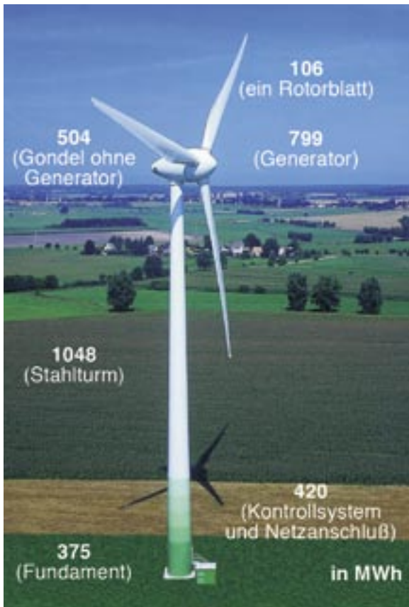
Abb. 5: Eine 1500 kW-Windenergieanlage energetisch gesehen: Die Zahlen geben die kumulierten Primärenergieaufwendungen (in MWh) zum Bau der Anlage – unterteilt nach Baugruppen - an. Insgesamt werden für diese Windenergieanlage 3464 MWh Primärenergie benötigt, das ist genau so viel wie an Energie in rund 120 m 3 Rohöl steckt – also über 17 große Tankwagen voll.

nenland in 65 Metern Höhe montiert (Nabenhöhe). Die größere Anlage hat dagegen eine Nabenhöhe von 67 Metern. Die Energieaufwendungen variieren, weil je nach Standort verschiedene Türme und Fundamente zum Einsatz kommen, weshalb z. B. unterschiedliche Transporte ablaufen. Ebenso sind die durchschnittlichen Windgeschwindigkeiten an den verschiedenen Orten verschieden: Sie liegen zwischen knapp sechs Metern pro Sekunde und 7,3 Metern pro Sekunde. Dieser Unterschied klingt zwar gering, aber macht 80 Prozent mehr Stromerzeugung aus: Wenn sich die Windgeschwindigkeit verdoppelt, verachtfacht sich die erzeugte Menge Strom. Die Windgeschwindigkeit ist damit eine der wesentlichen Einflussgrößen in der Energiebilanz.