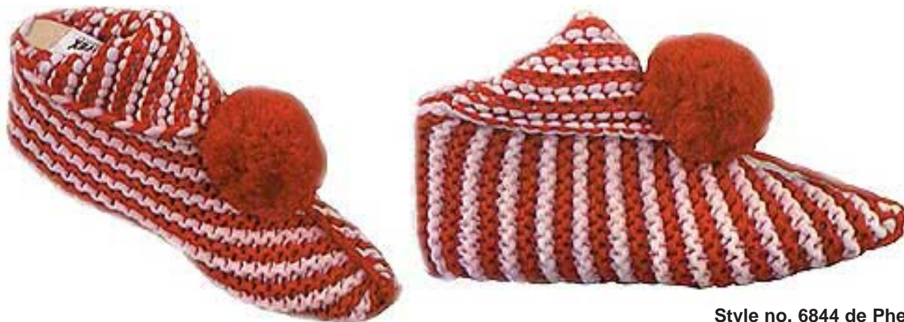
Style no. 6844 de Phentex

Laine: 1 balle de Phentex 3 brins de la couleur principale et 1 balle de couleur contrastante pour toutes les grandeurs