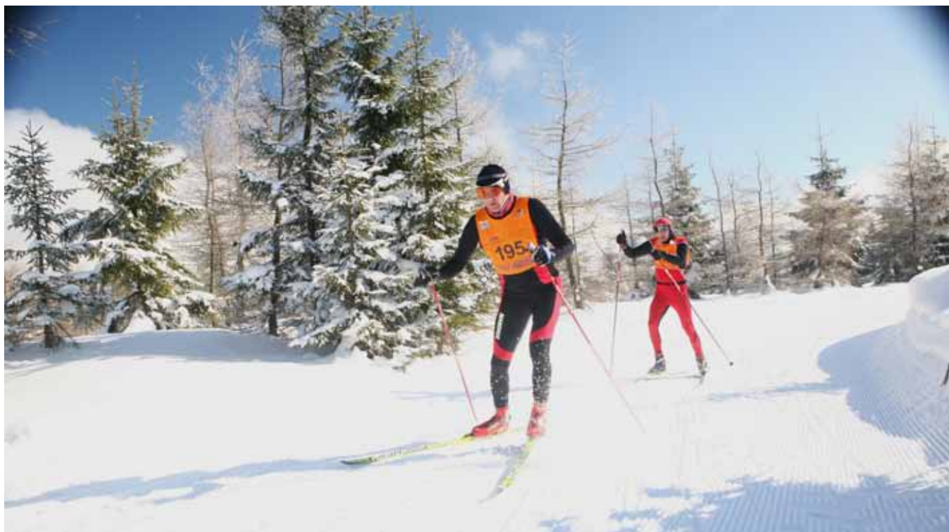
Friske oppgjør, her fra Bieg Piastow i Polen.