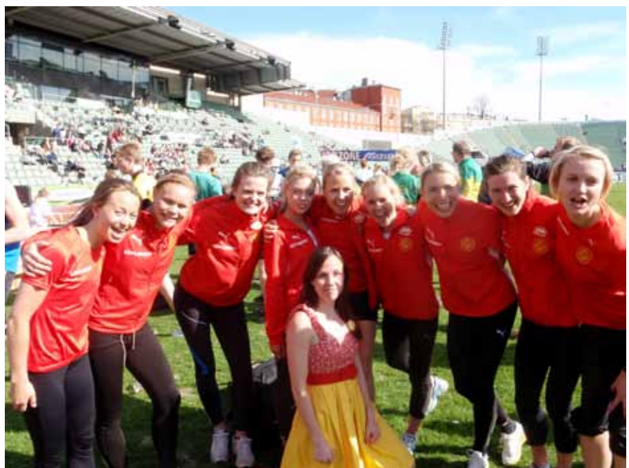
Deler av søvlaget.

de siste to etappene, måtte Idrottslaget bite i det sure eplet og innfinne seg med at de ikke lenger var Norges beste klubb i Holmenkoll-sammenheng. Sju sekunder skilte opp til Tjalve, og selv om Kjetil Måkestad og Ådne Svahn Dæhlin oppnådde beste etappetid, så var ikke den samlede laginnsatsen god nok ved denne anledningen.