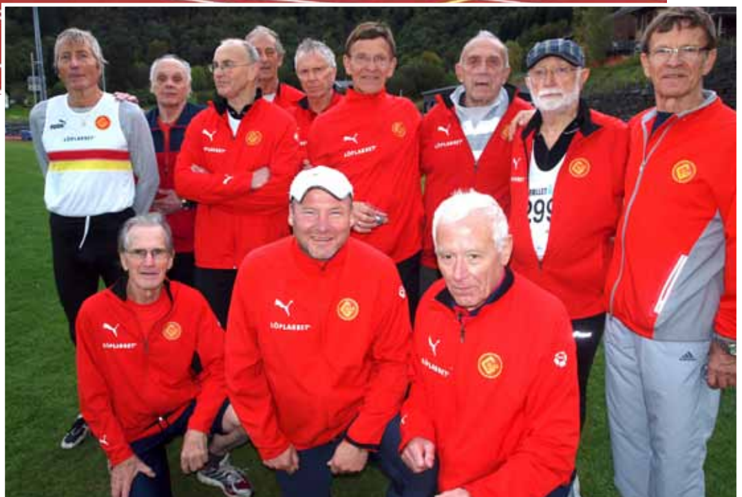
Ein staseleg gularflokk!