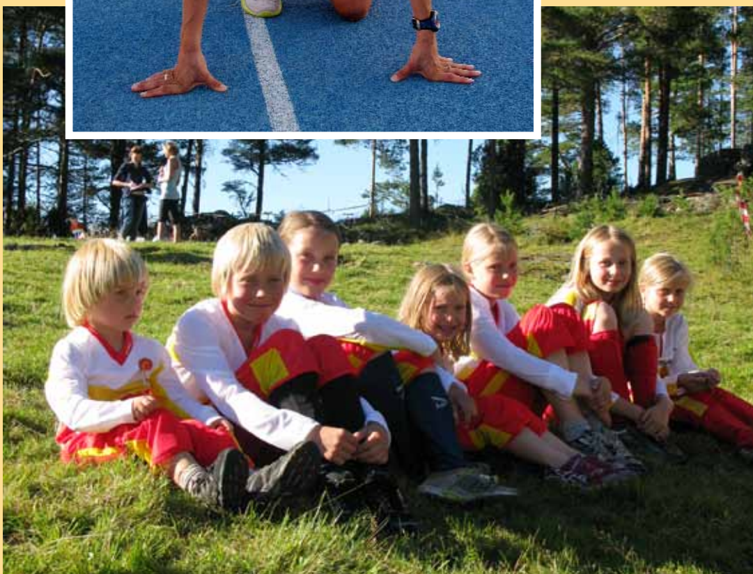
Det gror i o-gruppa [no står det skrivefeil «Orienteringsrekrutter»]