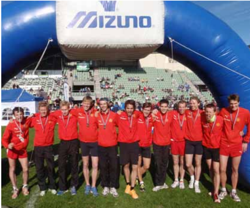
Sølv også på herrene.