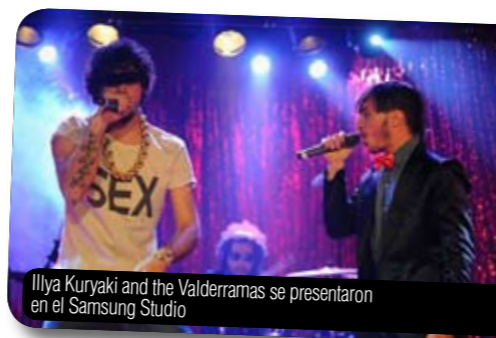
Illya Kuryaki and the Valderramas se presentaron en el Samsung Studio

Kevin Johansen , tras una gran gira por Bolivia, emprende la gira Musimundo en concierto por la Patagonia en Neuquén, Bariloche, Viedma y Bahía. Confianza total hacen los últimos cursos del año el 9 y 10 de septiembre y continúan con un plan de promoción en Argentina y Colombia. Avanza el Banco Macro Tour con El Chaqueño Palavecino , Fito Páez tiene el 11 de octubre el Gran Rex en piano y con invitados, y Soledad el 10, 11 y 12 de noviembre. Serán en total de 33 shows en todo el país con la marca.