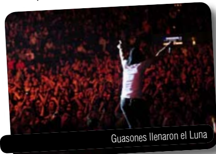
Guasones llenaron el Luna

Su corte Casi que me pierdo ya apunta a hit en todas las radios. El video se hace con Eduardo Pinto y Osky Frenkel. Tiene campaña en Rock & Pop, Mega, 40 Principales y La 100, en Quiero, Much y pautas en todo el interior como en Córdoba, Mendoza, Tucumán, Mar del Plata, Rosario, Santa Fe y Neuquén. Tocarán con Cultura Profética el 24 de septiembre.