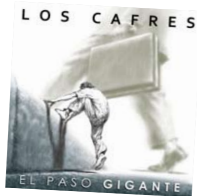
Nuevo CD de Los Cafres

en La Trastienda el 13 de septiembre, adelantando 25 años de vida. La gran presentación será el 5 de noviembre en el Palacio de los Deportes de México donde se filmará en HD un registro con importantes invitados. Sigue con el corte La Fórmula .