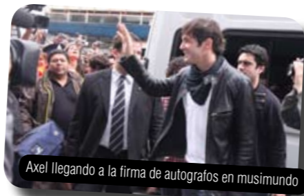
Axel llegando a la firma de autógrafos en musimundo

A 65 años del nacimiento (y casi 20 de su muerte) de Freddie Mercury , se destaca el show de la banda tributo a Queen Dios Salve