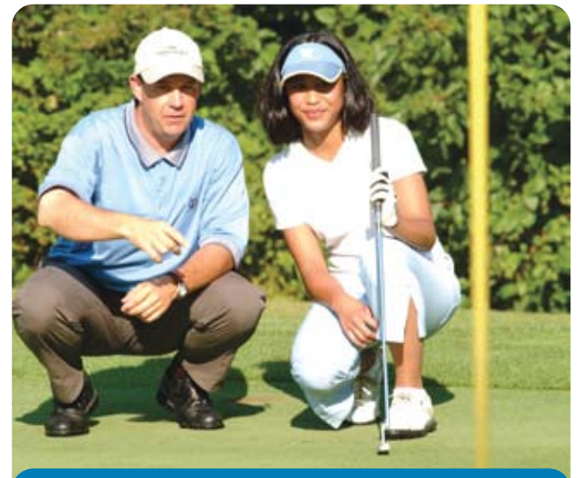
溫哥華的公眾高爾夫球場既收費合理，又交通方便，更設有預訂服務。

你有試過在球道上玩越野滑雪嗎？有試過在大雪覆蓋的最後九個高爾夫球洞上行走嗎？公園局轄下位於 Fraserview、McCleery、Langara 的 3 個錦標高爾夫球場和 3 個位於 Stanley Park、Queen Elizabeth Park、Rupert Park 的小型高爾夫球場，全年為市民提供高爾夫球活動。2009 年 1 月和 2 月的創紀錄大雪，令球場被迫部分關閉，幸而典型的西岸海岸氣候回歸令服務得以恢復正常。過去一年，公園局繼續致力改善高爾夫球的營運和提高客戶的滿意程度。在 2009 年，多達 132,000 場高爾夫球經由網上預訂（活動前 5 天不加收費用，6-30 天酌量收費），此外許多客戶亦訂閱了每月的電子通訊和定期的優惠推廣活動。首年舉辦的溫哥華高爾夫球專業公開賽更受媒體廣泛的報導和公眾關注。設備一流的高爾夫球場、課堂、比賽套餐、特別活動、青年節目、精品專賣和露天食堂等，能滿足不同程度和年齡的球員的需求。