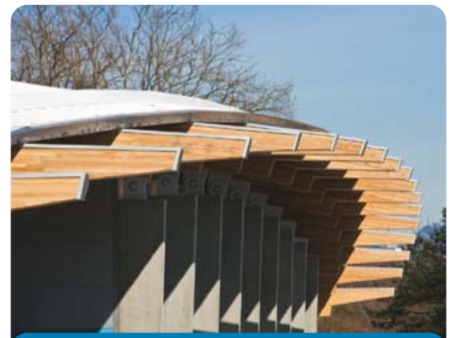
Trout Lake 溜冰場作為社區康樂中心重建的第一期，其建築大量展示了BC省出產的木材，包括在史丹利公園風災中倒下的樹木。

溫哥華公園局的其他項目和計劃也為本屆冬奧會注入了精采與活力，包括在 David Lam Park 建造 LiveCity 慶祝場地；同意將 Jericho 海灘和西班牙岸灘作為拖車（RV）營地，以容納更多冬奧遊客；舉辦冬奧會一周年倒計時活動，包括免費的滑冰和冬日城市漫步；支持在各個社區舉行奧運慶祝活動；在場館和公園舉辦公共藝術展；策劃火炬傳遞；在社區中心安排特別的活動；和為市民提供網絡和書面資訊。