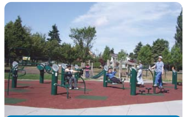
Tisdall 公園內西北角全新的健身活動區為耆英提供一個安全健身的場所。

對很多溫哥華人來說，年齡只是一個數字。去年夏天，在49街 Tisdall Park 興建的耆英健身活動區為年紀較長的居民創造了一個保持積極、健康、獨立生活的環境。這項計劃由 ActNow BC 資助。13個活動站選用了加拿大最先進的室外健身設施，適合成人使用，包括踏步機、蹲步機、平衡步機、太極輪等。優雅的公園廣場由花園苗圃、長凳、樹蔭點綴，可供居民憩息小坐，將健身運動融入日常生活，成為老人聚會、交友的場所。談到年輕的心，溫哥華綜合醫院（Vancouver General Hospital）的「快樂的心同盟」（Happy Hearts Alliance）健身中心在 Kensington 社區中心成立，有註冊教練和診所職員幫助病人康復，並提供心血管健康方面的指導。