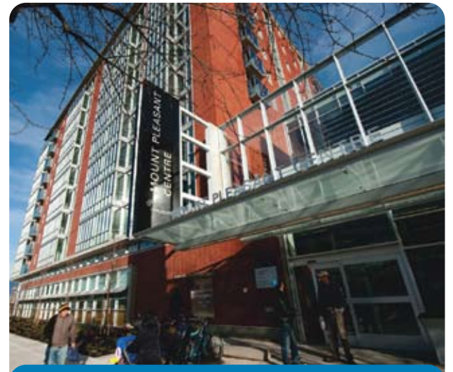
位於 Kingsway 1 號的 Mt. Pleasant 社區中心是一所全新落成的多用途服務中心。

去年底開幕的新 Mt. Pleasant 社區中心坐落於 Kingsway 1 號。新建成的社區中心比舊有在 16th Avenue 夾 Ontario Street 的面積大百分之二十四，包括從原址遷入的 Mt. Pleasant 分區圖書館、幼兒發展中心、咖啡廳和出租柏文。中心的主要設施包括大型體育館（內置一道高 26 呎的攀登牆）、廣闊的健身中心、舞蹈室、多用途房間和戶外空間。另外，由藝術家 Fiona Bowie 創作及安裝的藝術品 "Flow" 將變化多端的照片投映到臨街的窗戶上來招呼訪客。這個擁有高度建築效能的新社區中心，不但符合 LEED 金牌認證的高水準，還引進多項既健康又環保的創新設計。至於已被拆除的舊社區中心，原址將會回復 1966 年前的綠色空間；新公園的概念已獲批准，當局稍後會徵詢市民有關設計和安排上的意見。