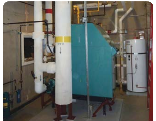
去年，9 個在 Renfrew Community Centre, Vancouver Aquatic Centre, Sunset Arena, Hastings Community Centre 及 Sunset Nursery 的舊式鍋爐已被更換。

填滿在社區中心、泳池、溜冰場及其他設施機械室的大型舊式鍋爐正漸漸被取締。鑑於可持續發展是公園局的其中一項指標，在 20 世紀初舊式的加熱技術，現已改為由輕巧而高效能的冷凝式鍋爐取代，將以往由煙囪排走的熱能循環再用。這個計劃由市府的第二期「Corporate Climate Change Action Plan」領導，該方案旨在降低溫室氣體的排放量，相等於每年減少 330 架車輛在路面行走。現時已在 30 個不同地點進行超過 120 項工程，提升了通風、取暖、加熱、控制設備和照明系統。另外，一個試驗性的網上能源使用監察系統在 2010 年溫哥華冬季奧運會、殘障奧運會期間，於 South East False Creek 文娛中心成功運作。這個屬於 BC Hydro 策略之一的系統將會在本年加設於 Sunset Community Centre 和 Vancouver Aquatic Centre。