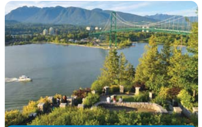
從新的 Lowden 觀景台盡覽 Burrard 灣、獅門橋（Lions Gate Bridge）和北溫山景。

2009年，溫哥華人至愛的史丹利公園最後重建階段，終於在其熱門的景點之一——觀景點結束。在觀景點周圍的道路被重新調整之後，一個全新的觀景平台對外開放。這項工程不僅讓史丹利公園本身受益，也讓每年800萬前來參觀的遊客可以更加安全、舒適地享受美景。此外，擴充後的停車場可容納更多車輛和巴士；先進的排水系統可讓崖壁免受海水侵蝕；新架設的旗桿以凸顯觀景點的歷史意義；擴建的花園種滿了本土栽培的植物；還豎起一座紀念碑，以感謝為公園改建而慷慨解囊的人。